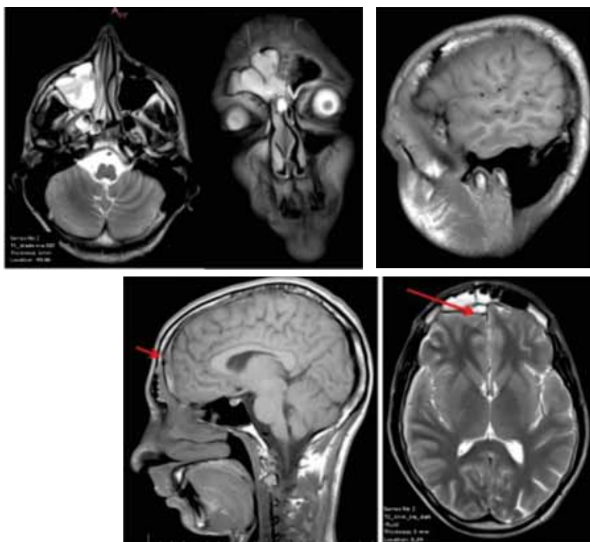
FIGURA 1. RMN cerebral (a,b,c,d,e)

O metaanaliză realizată pe 51 de studii care au evaluat etiologia supurațiilor cerebrale localizate a cumulat 2653 de culturi din LCR, dintre care 30% au fost negative și 26% polimicrobiene (6). Frecvența etiologiei polimicrobiene pare să fie mai mare, estimată la peste 50% dintre supurațiile cerebrale. Cele mai frecvente specii bacteriene izolate au fost: Streptococcus spp (36%), Staphylococcus spp (17%), Enterobacter spp (12%), Bacteroides spp (7%), Haemophilus spp (3%), Peptostreptococcus spp (3%), alte categorii (17%) (4). Bacteriile anaerobe se asociază în majoritatea supurațiilor