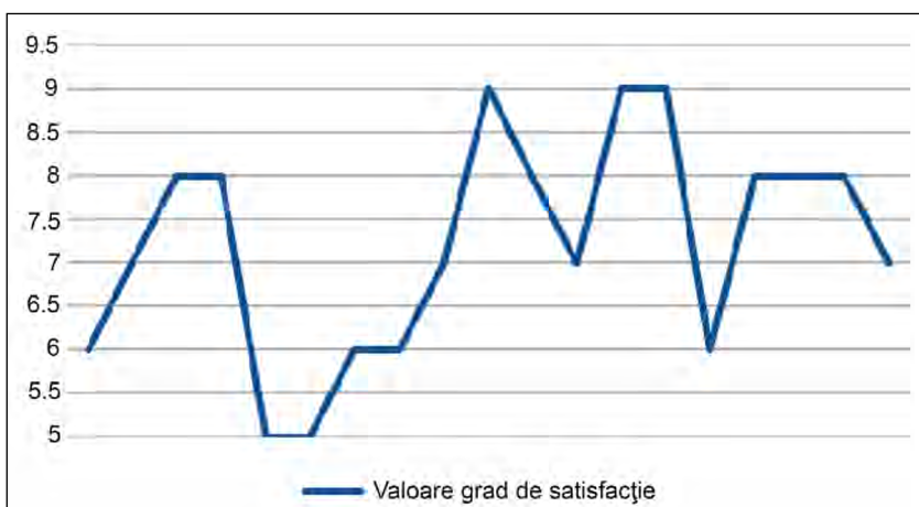
FIGURA 4. Grad de satisfacție în cazul pacienților cu complicații postoperatorii