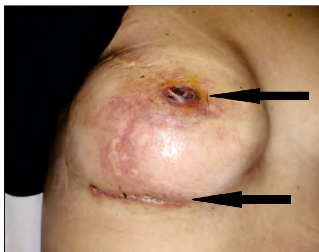
FIGURA 1. Dehiscenta plăgii operatorii și necroză

În ceea ce privește calcularea BMI, întregul lot a avut o valoare medie de 25,4, cu o valoare minimă de 18,4 și valoarea maximă de 31,2.