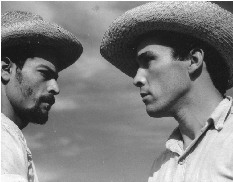
Ned Scott, foto fija, Miro y Miguel se enfrentan uno a otro. Reproducida con autorización del Archivo Ned Scott.

Cuando Miro tira el pescado al suelo y los pescadores pelean a golpes y navajas, la cámara muestra la fuerza física y la pobreza,