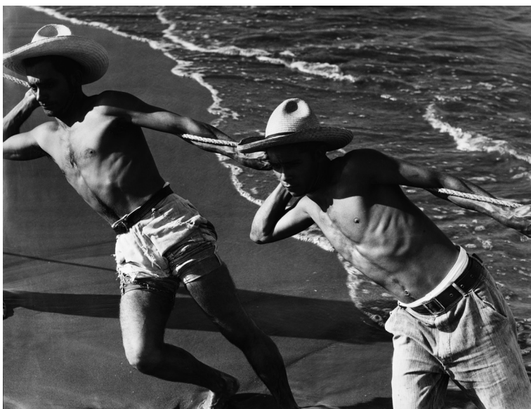
dos pescadores tirando de una red. 47

Después de la secuencia de la pesa del pescado, en la que los pescadores reciben una paga mínima, encontramos, o mejor dicho el espectador-trabajador los encuentra extendiendo y remendando las redes. Un viejo pescador apodado El Zurdo se queja: “Después de veinticinco años de trabajar por unos cuantos centavos a un hombre se le moja el cerebro y se le seca el corazón”. Otro viejo pescador de nombre Felipe le aconseja, regañando, ir a la iglesia y dejar de beber, pero El Zurdo lo reta: él no está dispuesto a pagar para entrar al cielo. Beber, por lo menos “te hace olvidar a esos con sus redes y sus malditos botes; esos que tienen todo y no te dan nada”. Furioso, El Zurdo ataca