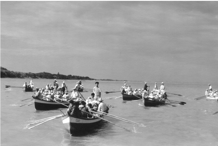
Ned Scott, foto fija, pescadores unidos atraviesan el río con el cuerpo de Miro. Reproducida con autorización del Archivo Ned Scott.