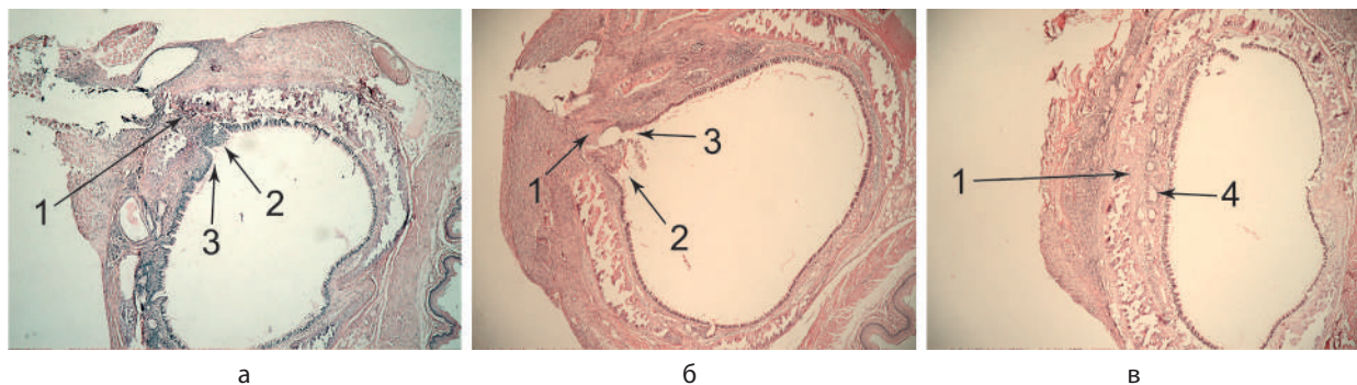
Рис. 2. Крыса, морфологическая структура стенки трахеи, просвет трахеи, срез на уровне средней трети трахеи, 7-е сутки исследования: а – группа 1 (1 – послеоперационная рана, 2 – лейкоцитарный инфильтрат, 3 – карман в слизистой оболочке трахеи); б – группа 2 (1 – послеоперационная рана, 2 – лейкоцитарный инфильтрат, 3 – карман в слизистой оболочке трахеи); в – группа 3 (1 – послеоперационная рана, 4 – слизистая оболочка трахеи без дефекта). Окраска гематоксилином и эозином. Объектив \times 10 , окуляр \times 10