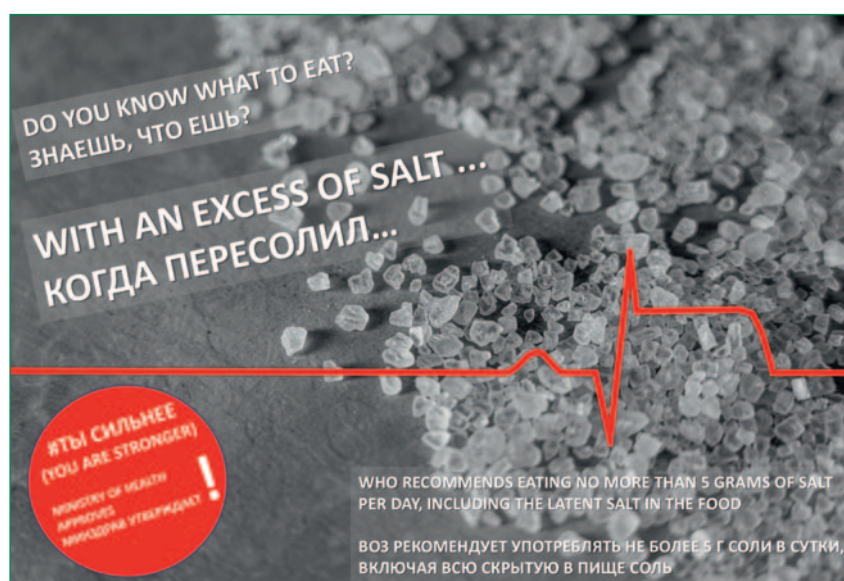
Figure 3. Example of an information poster on salt intake WHO – World Health Organization