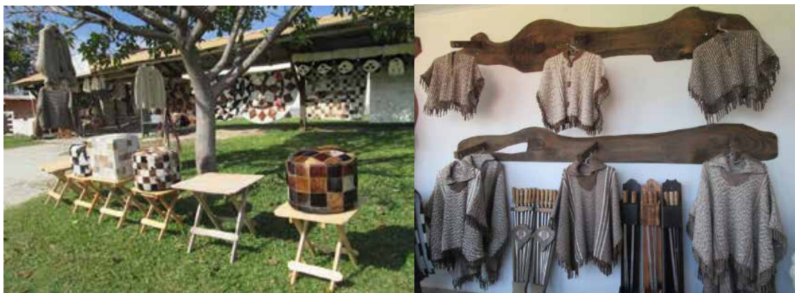
Figura 2 – Tendas artesanais na Vila Progresso