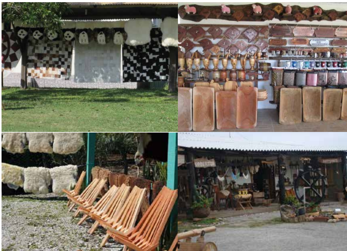
Figura 3 – Diversidade de artigos artesanais nas tendas da Vila Progresso