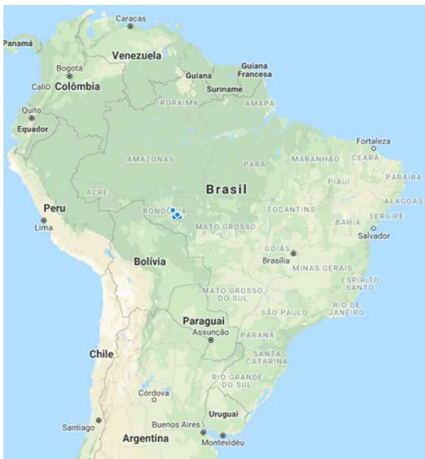
Figura 2 – Localização das cooperativas