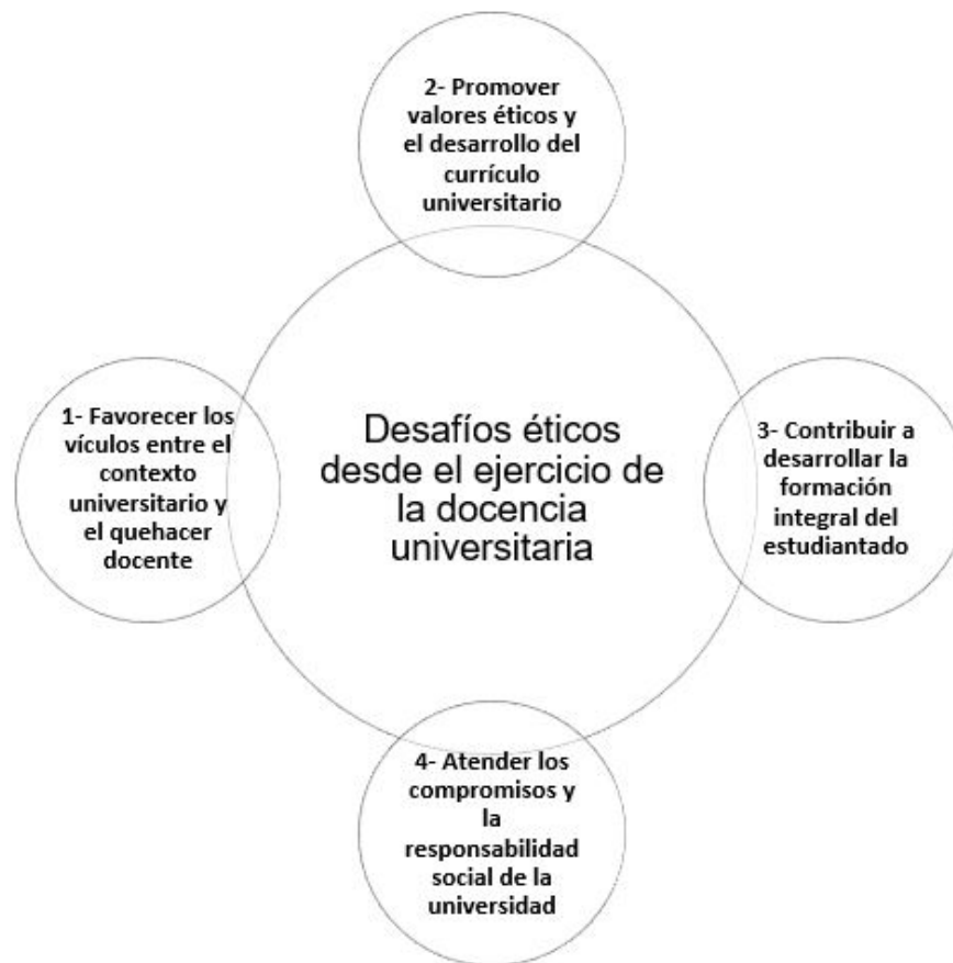
FIGURA 1 Desafíos de la docencia universitaria Elaboración propia

En relación con el contexto universitario y su vínculo con el quehacer docente, la universidad pública latinoamericana debería dialogar con los grupos sociales para coadyuvar a la atención de problemas complejos que implican la formación de personas con compromiso social y humano, atendiendo a la vez las necesidades del profesorado. Por ello, para la comunidad universitaria es preciso contar con condiciones óptimas de infraestructura universitaria, una excelente mediación pedagógica y sobre todo experiencias innovadoras más allá del salón de clases (Carvajal, 2013).