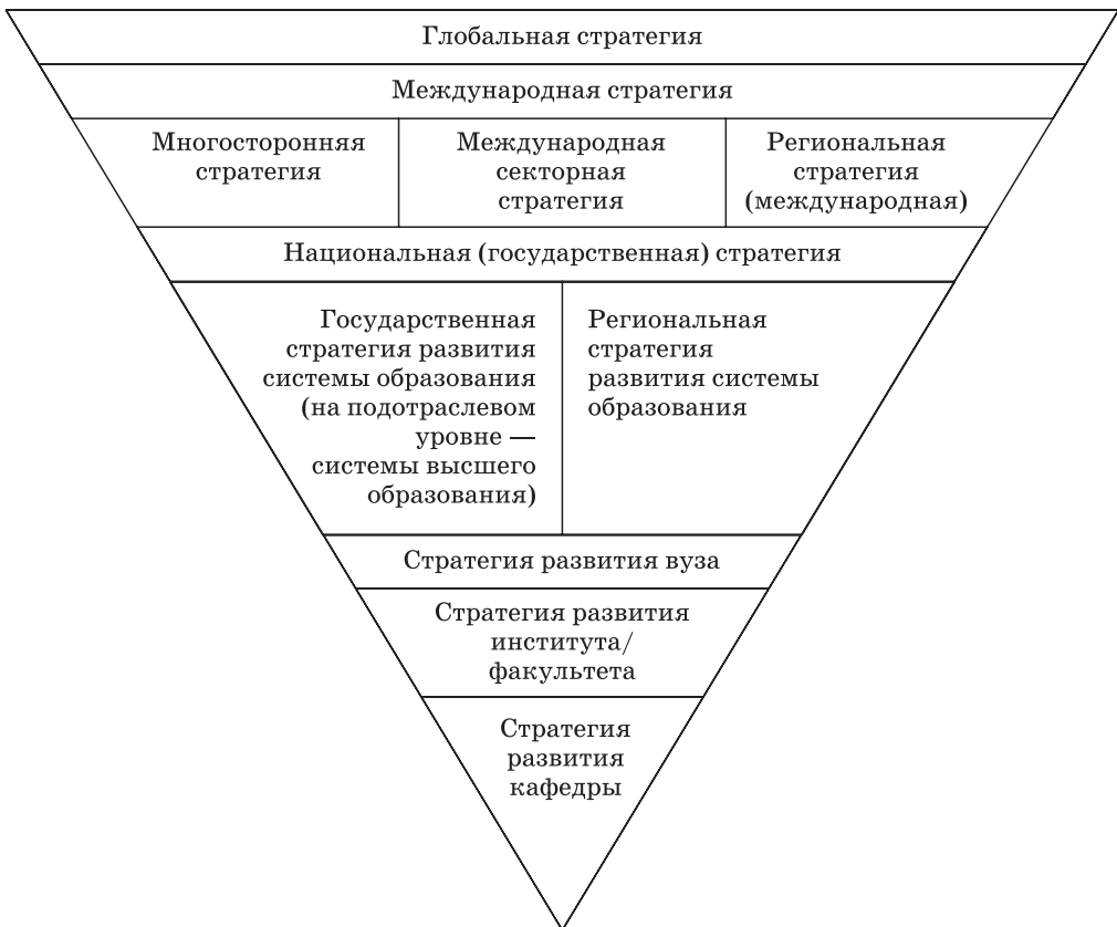
Рис. 3. Система стратегии развития высшего образования Fig. 3. System development strategy of higher education

Представленная система стратегии отражает взаимосвязь различных уровней стратегии. Неучет особенностей, трендов и закономерностей вышестоящего уровня стратегии влечет неактуальность и неэффективность каждой нижестоящей стратегии, снижается ее ценность и прикладное значение. Эффективной стратегии присуща гибкость, быстрое реагирование на новые вызовы. В каждую из стратегий на различных уровнях иерархии стратегии в последующем вносятся необходимые корректировки, с учетом глобальных и международных процессов, ситуации в стране, в регионе, изменений в отрасли и т. д. [3, с. 111].