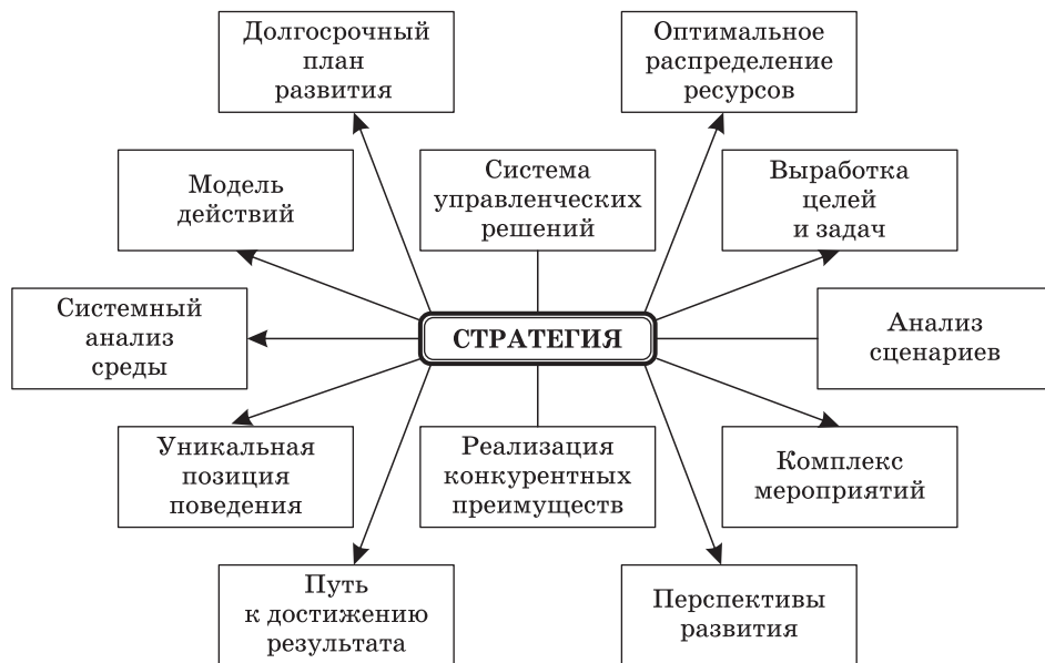
Рис. 1. Ключевые позиции в определении понятия «стратегия» Fig. 1. Key positions in the definition of «strategy»