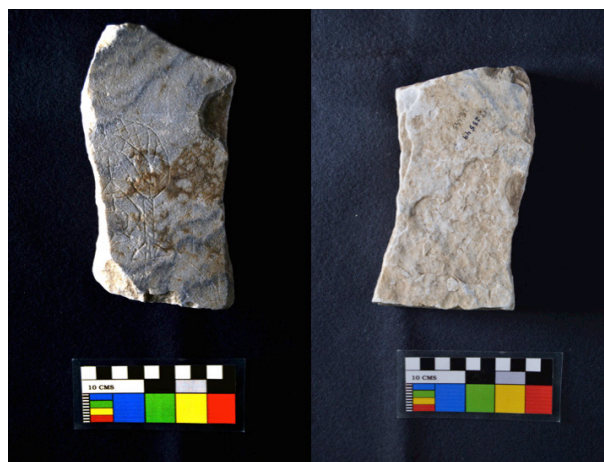
Fig. 1. Placa, anverso y reverso.

Sistemático del museo, realizada en noviembre de 2002, la pieza procede de las excavaciones del teatro romano 11 . No se especifica nada más, salvo que se trata de la pieza número 13 de la bolsa 23.549 correspondiente a dichas excavaciones. Por consiguiente, no tenemos información sobre el contexto arqueológico o estratigráfico en el que apareció la pieza. Tampoco sabemos en qué año fue hallada. Así pues, nuestra única referencia segura es que apareció en las excavaciones del teatro anteriores a 2002.