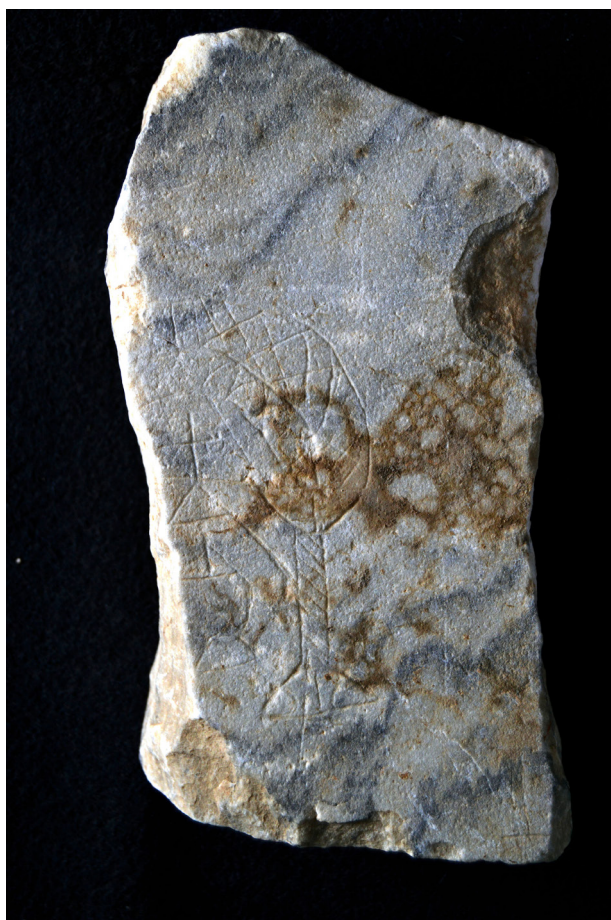
Fig. 2. Detalle del grafiti.

La imagen es muy explícita. Por un lado, se trata de un marco arquitectónico en forma de arco triunfal, típico de la iluminación de los beatos mozárabes y de algunos libros iluminados de época altomedieval. Muchas de las escenas más destacadas de este tipo de documentos aparecen enmarcadas en estructuras arquitectónicas como estas, donde el arco cobra protagonismo como elemento definitorio de la importancia de un contenido. Este recurso no es nuevo. Desde época bajoimperial encontramos la delimitación de contenidos destacados bajo arcos, como escenas bíblicas en sarcófagos o dípticos consulares. Incluso en época paleoislámica, la conformación del mihrab como nicho con arco