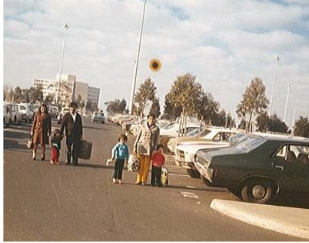
Fotoğraf 6: İlmiye kızlarını iki yıllığına arkadaş bir aileyle Türkiye'ye göndermek üzere Melbourne havalimanının otoparkında.