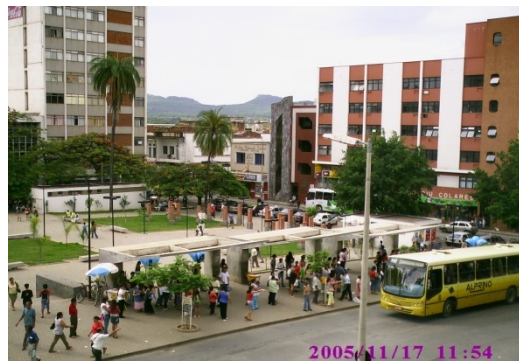
Figura 2 – Vista parcial da Praça Dr. Carlos Versiani