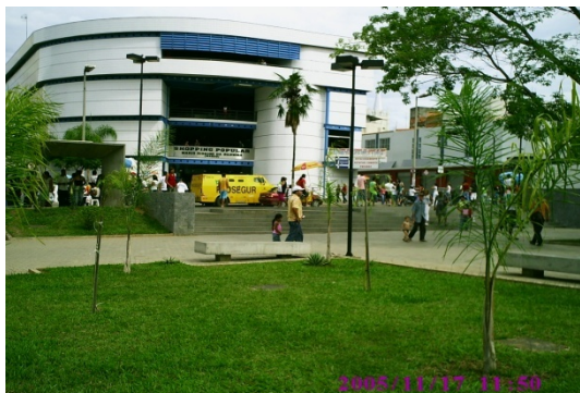
Figura 1 - Vista Parcial do Shopping Popular Mário Ribeiro da Silveira, localizado em frente à praça Dr. Carlos Versiani – área central de Montes Claros.

residencial, embora restrito. Ainda que o uso comercial caracterize esse espaço coexiste o uso residencial com a presença de edifícios em detrimento de casas. (Figura 1 e Figura 2).