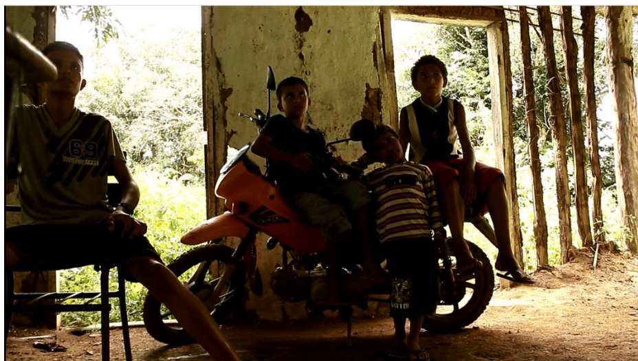
Figura 9. Still da filmagem realizada em Maio de 2013, em entrevistas com pais e estudantes numa das vicinais (estrada menor que sai da Transamazônica para dentro da floresta).

Queremos dizer com isso que os livros deveriam funcionar como documentos da realidade, como testemunhas de seu tempo e espaço, como dinamizadores dialógicos das existências entre lugares, entre pessoas que partilham coexperiências sem viverem copresenças e, ao mesmo tempo, explicitar a diversidade incontornável da experiência do espaço – não em uma visão genérica e repetitiva: o negro, o índio, o urbano, o rural, o homem, a mulher, mas em sua evidência problematizadora das condições de vivência – um documento de vontade de mudança, vontade partilhada entre diferentes.