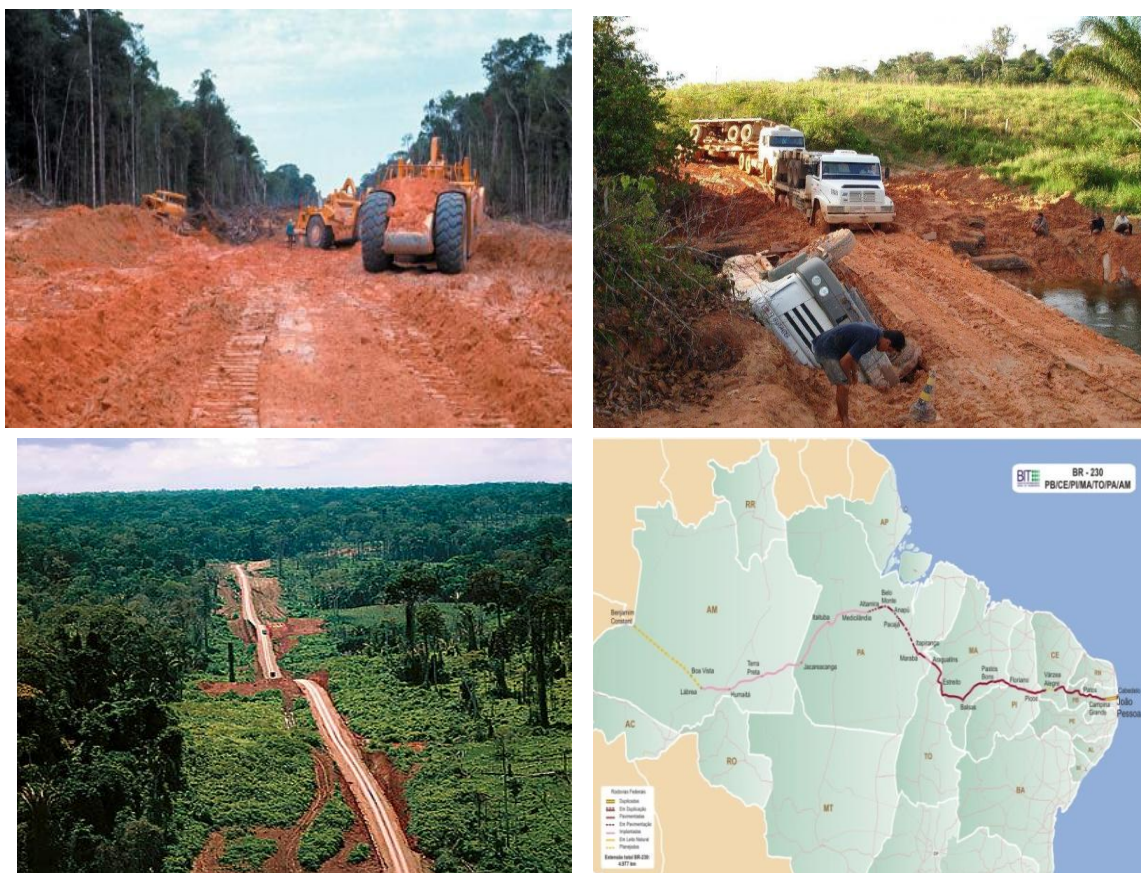
Figura 1. Transamazônica, 1971. Autor: Pierre Monbeig; 2. Transamazônica, 2014. Autor: Gilmar Lira; 3. Visão aérea de trecho da Transamazônica, 2011. Fonte: Revista Veja (on-line), autoria: www.tyba.com.br; 4. Detalhe do Mapa do Brasil demarcando a BR-230 ou Transamazônica (BIT- Banco de Informações e Mapas de Transportes, 2009).

As imagens a seguir são recorrentes quando o tema é a Transamazônica, em materiais didáticos e de ampla divulgação, quando não há uma imagem de referência, o texto repercute esta imagética: