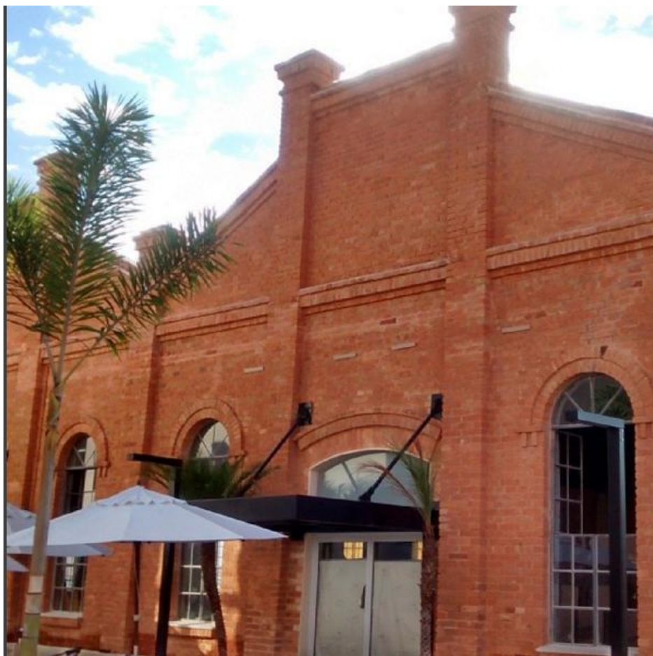
Figura 3. Rugosidade em Sorocaba

A presença de indústrias em Sorocaba não se limitou a do ramo têxtil. A partir da segunda metade do século XX a cidade passou a atrair novas indústrias, sobretudo pela construção das rodovias Raposo Tavares (SP-270), em 1954 e Castelo Branco (SP-280), em 1967. Tais eixos rodoviários foram fundamentais para o escoamento de produtos para outras regiões do estado. (COMITRE, 2010)