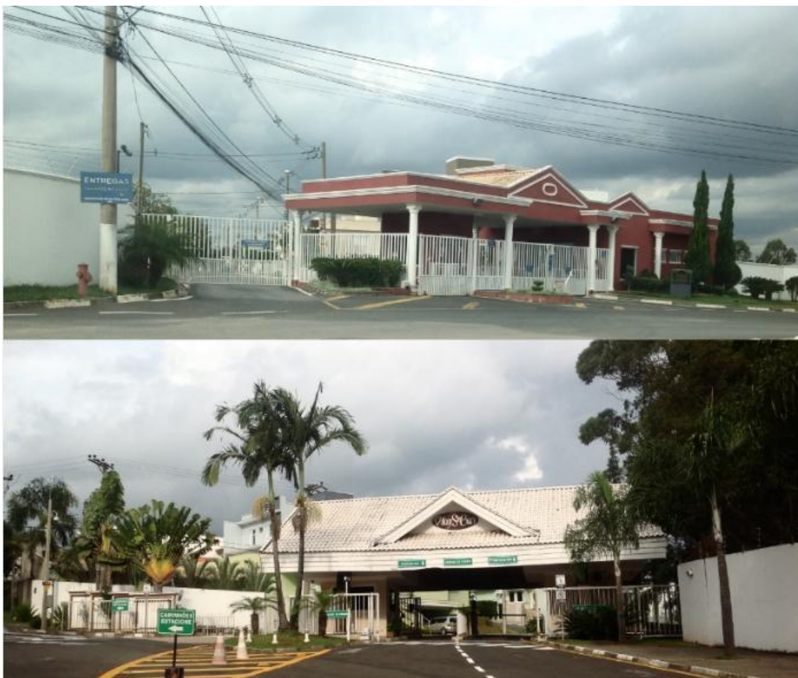
Figura 6. Condomínios Residenciais Fechados na Zona Leste de Sorocaba

A periferia em Sorocaba vem se tornando o local da ilusão de se viver em segurança, tornando-se o grande chamariz para a reprodução do capital. É principalmente na periferia que os empreendedores imobiliários vendem a possibilidade de morar em áreas ditas seguras e solidárias, oferecendo um verdadeiro menu de opções que convergem para um ponto em comum: a formação dos cada vez mais onipresentes enclaves fortificados.