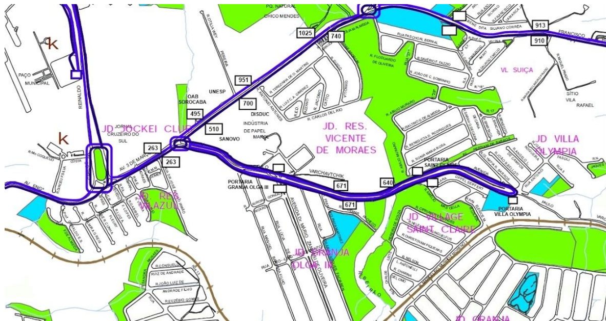
Figura 5. Condomínios Fechados na Avenida Três de Março

A área abrangida pela Avenida Três de Março e suas proximidades se depara cada vez mais com o processo de privatização do espaço público. Os bairros desde o final da década de 1990 estão sendo substituídos por vilas privativas, assemelhando-se ao que Caldeira (2000) explica como enclaves fortificados.