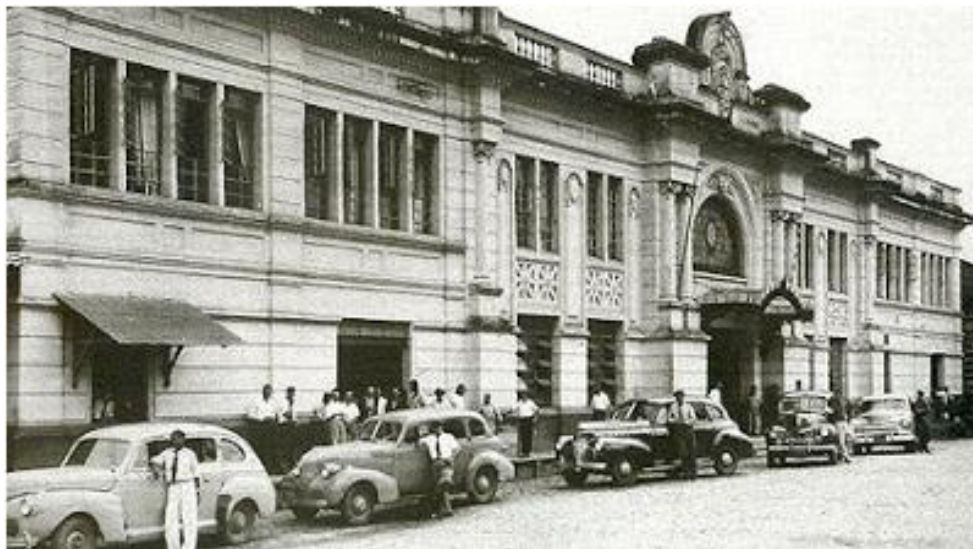
Figura 1. Estação da Estrada de Ferro Sorocabana

A figura 1 demonstra a estação central de ferro de Sorocaba no ano de 1949.