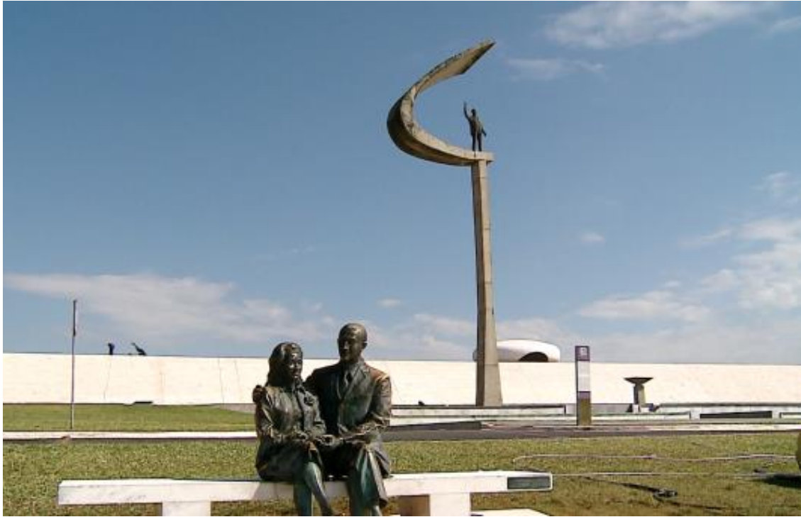
Figura 1: Memorial JK