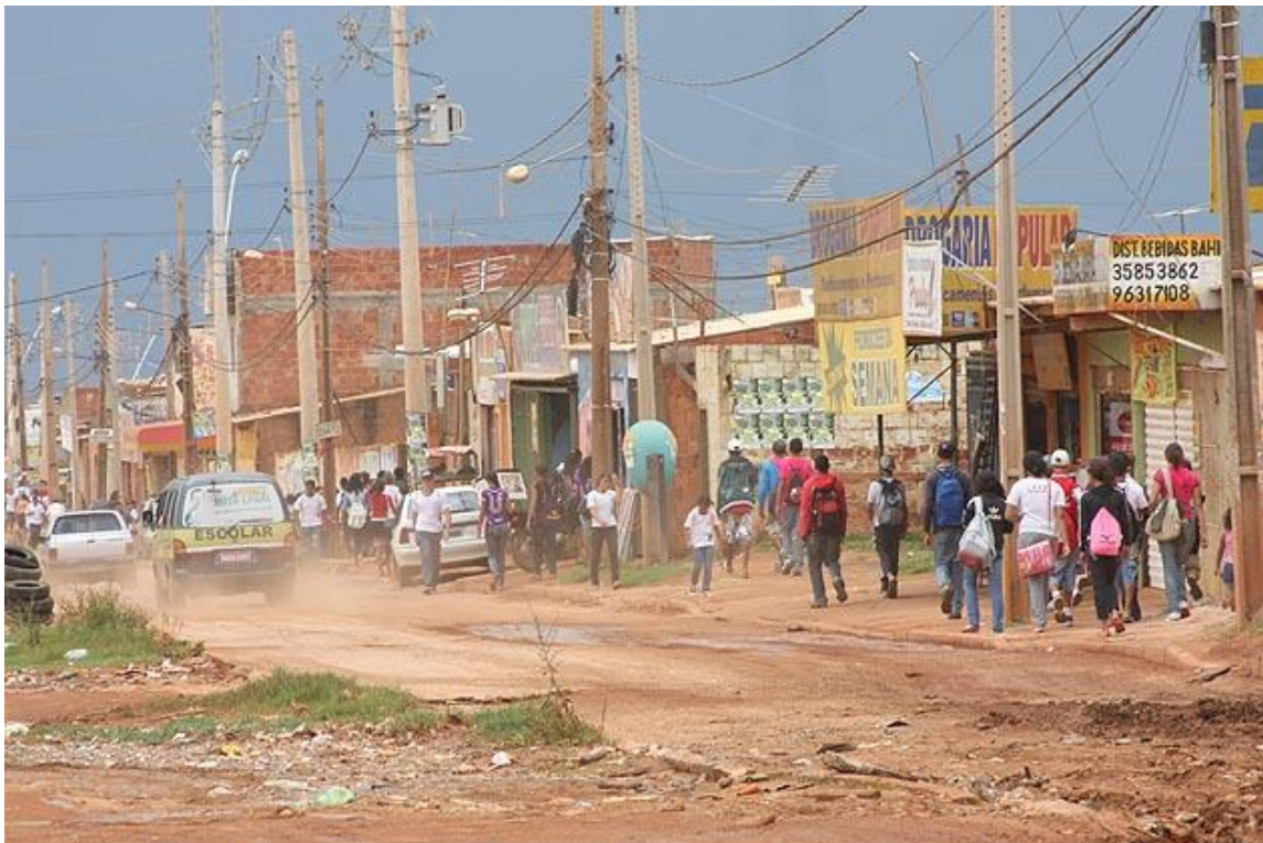
Figura 4: Sol Nascente, Distrito Federal

Até mesmo a mística da cidade do funcionalismo público é contestada pelo geógrafo da UnB, quando faz a seguinte constatação sobre a população do Distrito Federal: “[...] a rigor, Brasília, não seria, como se propala, a cidade dos funcionários públicos, pois não é essa a atividade que mais emprega. Aliás, o comércio, com 161.200 empregados em dezembro de 2004, encontra-se em terceiro lugar, com 16,8% dos ocupados da Capital.” (PAVIANI, 2006, p. 102). O presente e passado das contradições inerentes da concepção à construção da nova capital encontram-se, refletem-se, tornam a paisagem de Brasília mais espessa em sua complexidade, histórica e geográfica.