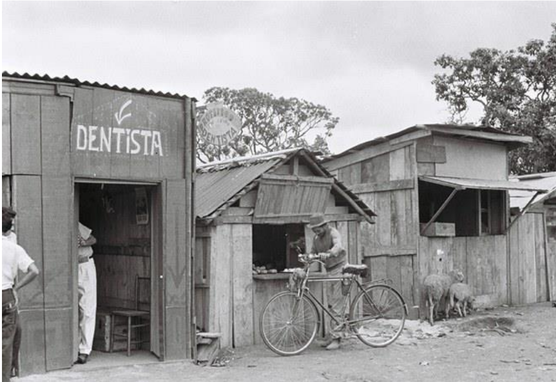
Figura 5: Comércio e Serviços Improvisados pelos candangos na Cidade Livre, atual Núcleo Bandeirante.

Este cenário, de sobreposição temporal e espacial, contribui para a consolidação da situação contemporânea não apenas de Brasília, como capital do país, mas de sua condição metropolitana no interior do Distrito Federal e seus arredores. A forma da capital do futuro é encontrada, ainda, nos monumentos erguidos em seu planejamento inicial. No entanto, o que se observa atualmente é o retrato da inevitabilidade das forças políticas, econômicas e sociais em contradição na totalidade do que Brasília se tornou para o Estado nacional e para si, em outras palavras, a capital construída como uma apartação da realidade histórica e espacial encontra-se transpassada por esta negação, como síntese (im)perfeita do território brasileiro.