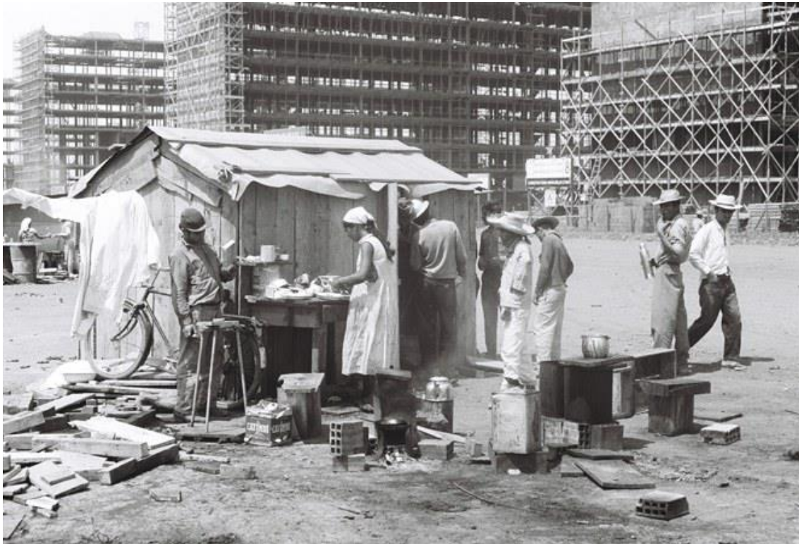
Figura 3. Trabalhadores em horário de almoço na Esplanada dos Ministérios, antes da inauguração da nova capital.

acaba por sintetizar esta desigualdade da modernização, proximamente aos limites do Distrito Federal e das regiões administrativas – antigas cidades satélites –, e nacionalmente, em comparação com o cenário urbano do país, como se refere Canclini (1998) sobre a modernidade e modernização: “[...] não chegamos a uma modernidade, mas a vários processos desiguais e combinados de modernização” (CANCLINI, 1998, p. 154).