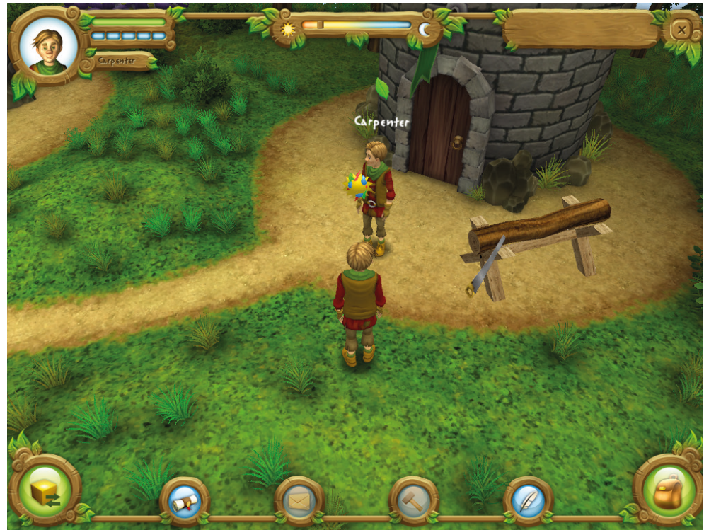
Abb. 1.: Screenshot aus dem Spiel Village Voices.

Die Spielenden können mit ihren produzierten Gütern auch handeln, um Produkte zu erwerben, die sie selbst nicht herstellen können. Zudem müssen sie für ihre Spiel-Charaktere auch menschliche Bedürfnisse wie Schlafen und Essen abdecken. Je mehr Levels absolviert werden, desto mehr sind die Quests darauf ausgelegt, dass die Charaktere miteinander kooperieren müssen, um das nächste Level zu erreichen. Dadurch wird die Abhängigkeit der Charaktere voneinander immer grösser und implizit steigt auch die Konfliktfähigkeit an (vgl. Yannakakis et al. 2010). Zusätzlich ausgelöst werden konfliktbehaftete Situationen durch das Spieldesign, da den Spielenden die Möglichkeit geboten wird, andere Charaktere zu bestehlen oder deren Häuser zu zerstören. Allerdings werden während des Spiels auch inhärente Reflexionstools angeboten, bei denen auf Basis einer Bewertungsskala gefragt wird, wie sich die Spielerinnen und Spielern fühlen (vgl. Cheong et al. 2015). Diese Reflexion geschieht immer nach einem erfolgten Handel, aber auch dann, wenn es zu Diebstahl oder Zerstörung kommt. Das Ziel des Spiels ist es, die Ambivalenz zwischen der Förderung von zwischenmenschlichen Beziehungen im Dorf, dem gemeinsamen Lösen der einzelnen Spiellevels, aber auch dem eigenen Wohlergehen auszubalancieren (vgl. Schmoelz et al. 2017). Künstlich herbeigeführte Konflikte führen dazu, dass sich die Spielenden mit Problematiken in zwischenmenschlicher Interaktion auseinandersetzen müssen,