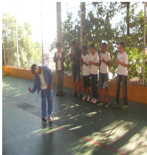
Figura 4: Chula