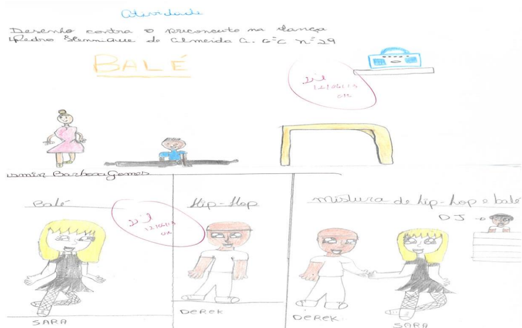
Figura 7: Trabalho sobre preconceito nas danças realizado pelos alunos

cultural inserido nesse diagnóstico e que tanto as pessoas brancas podem se interessar por hip hop, como as pessoas negras podem se interessar por balé. Um filme que discute muito essas questões e que utilizamos para causar reflexões nos estudantes foi ‘No Balanço do Amor’. Assistimos ao filme durante as aulas na escola e pedimos que os alunos respondessem a seguinte questão: existem danças para pessoas de pele negra e danças para pessoas de pele branca? A maioria dos alunos entendeu o filme e respondeu que culturalmente isso existe, mas que as pessoas precisam respeitar a vontade dos outros e cada ser humano pode dançar o ritmo musical que desejar, independente da sua cor, etnia, opção sexual ou gênero. Também mencionamos o contexto histórico de diversas danças para explicar porque certas práticas corporais eram mais praticadas por pessoas de etnias diferentes. Abaixo, encontra-se um desenho que os alunos realizaram ao analisar o filme assistido.