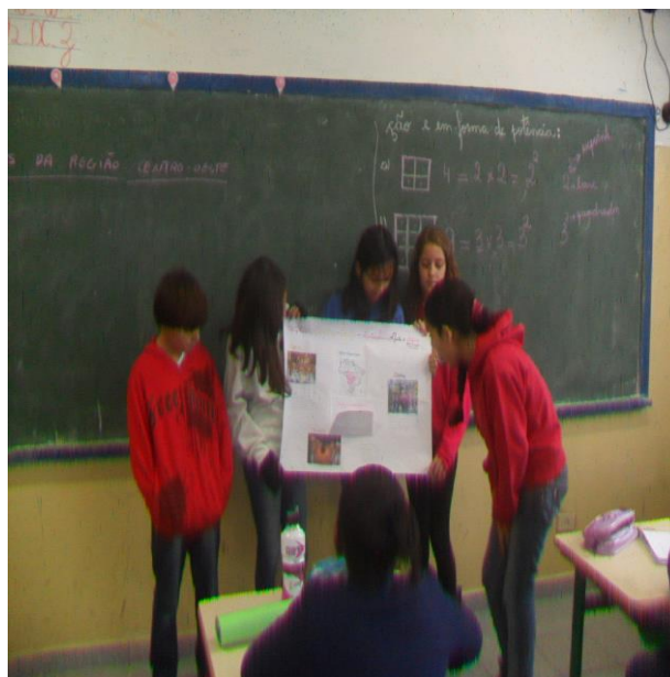
Figura 1: Alunos apresentando os cartazes de danças das diferentes regiões do país

Após a realização dos trabalhos, os estudantes apresentaram as suas pesquisas para o restante da turma, que anotaram as principais danças das diferentes regiões do Brasil encontradas pelos grupos. Nesse momento, os grupos escolheram uma das danças pesquisada para ensaiar e apresentar na escola durante as aulas de Educação Física.