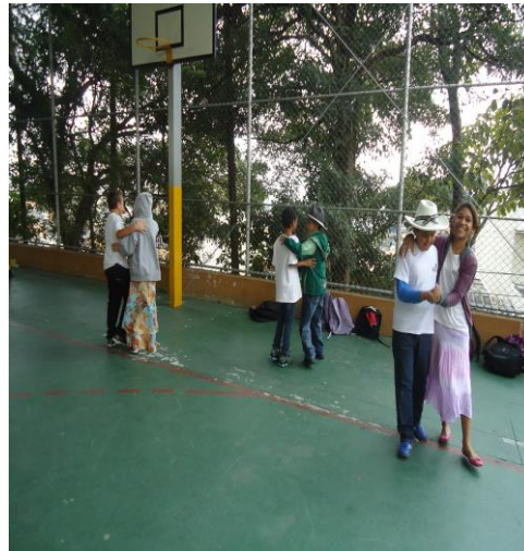
Figura 3: Carimbó