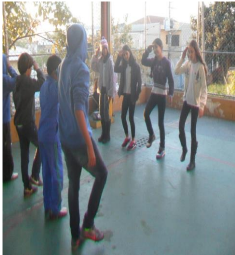
Figura 2: Catira