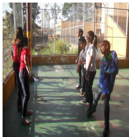
Figura 6: Axé