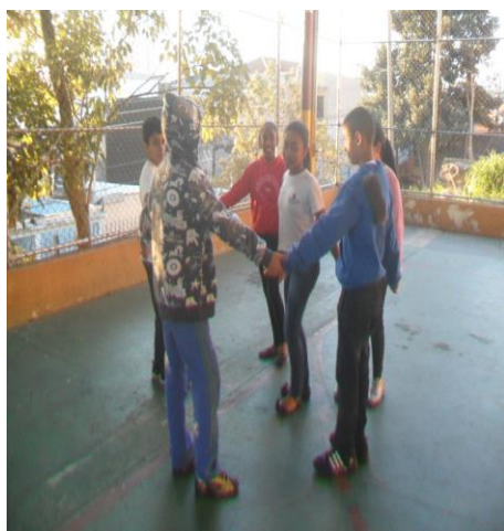
Figura 5: Samba