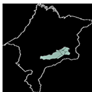
Imagem 1 – Mapa da região do médio sertão maranhense.

racterísticas básicas das quatro comunidades escolhidas (Peixe, Tabocal do Belém, Jaguarana e Cambirimba), concentrando na organização social, no parentesco e na vida ritual 7 . A cada etapa da pesquisa de campo, fomos levados pela amplitude de saberes que demonstravam as principais lideranças da comunidade de Cambirimba, sobretudo as mulheres, que, de imediato, se colocaram à disposição e se habilitaram para colaborar com o nosso trabalho, narrando suas trajetórias e apresentando seus saberes sobre os “seus mundos”. Todavia, não deixamos de olhar para as outras comunidades, que se dispuseram da sua maneira a fornecer caminhos para lançar reflexões sobre outras temáticas tangentes às relações interétnicas, como se observa na localização espacial da região em estudo (Imagem 1).