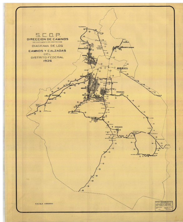
Figura 1 - Plano del Distrito Federal que muestra la expansión urbana en la década de 1920. Fuente: Mapoteca Orozco y Berra, Colección General, Distrito Federal, Autor: J García, SCOP, 1926. Escala 1:100 000. Varilla CGDF01, No. Clasificador, 1195-CGE-725-A

dirigidos a los sectores populares. Es el caso de las colonias Obrera, Hidalgo, Morelos o Peralvillo, casi todas concebidas como ensanches. Las primeras conurbaciones ocurrieron al despuntar el siglo XX, cuando la mancha urbana alcanzó las localidades históricas de Tacubaya y Tacuba, gracias a la expansión y modernización del sistema de transporte de tranvías. En esta época la ciudad vivió su primer auge inmobiliario con la aprobación de docenas de fraccionamientos promovidos por desarrolladores locales y extranjeros (JIMÉNEZ MUÑOZ). Este boom apuntaba a una sobreoferta de lotes unifamiliares, fue interrumpido por la Revolución de 1910. Una década más tarde, una vez recuperada la estabilidad política y económica, la ciudad disponía de una extensa oferta de suelo que orientó el crecimiento urbano en los primeros años posrevolucionarios. Aun así, en 1921 se construyó el primer suburbio residencial separado de la ciudad por el parque urbano Bosque de Chapultepec y por lo tanto accesible solamente en auto particular.