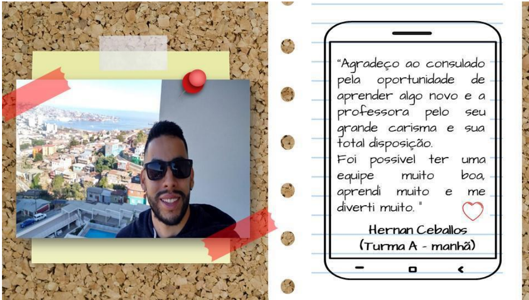
Imagem 4: Relato de um estudante