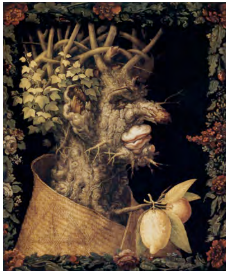
Fig. 3 Giuseppe Arcimboldo Les saisons , 1573 76 x 64 cm. Musée du Louvre, Paris