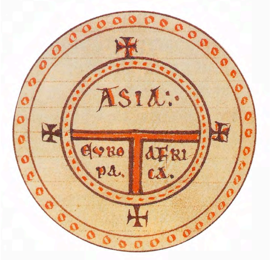
Fig. 6 Manuscrit espagnol des Etymologiae Le mappemonde selon Isidore de Séville, XIIème siècle British Library, London