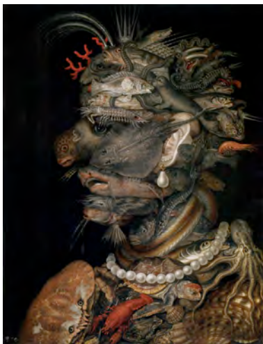
Fig. 5.4 Giuseppe Arcimboldo Eau , 1566 67 x 51 cm. Kunsthistorisches Museum, Vienne