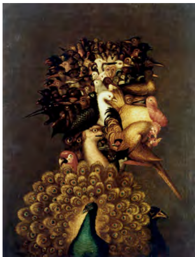
Fig. 5.1 Giuseppe Arcimboldo Air , c. 1566 74 x 56 cm. Collection privée, Vienne