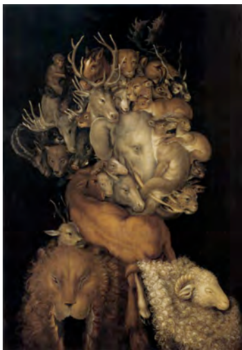
Fig. 5.2 Giuseppe Arcimboldo Terre , 1566 70 x 49 cm. Collection privée, Vienne