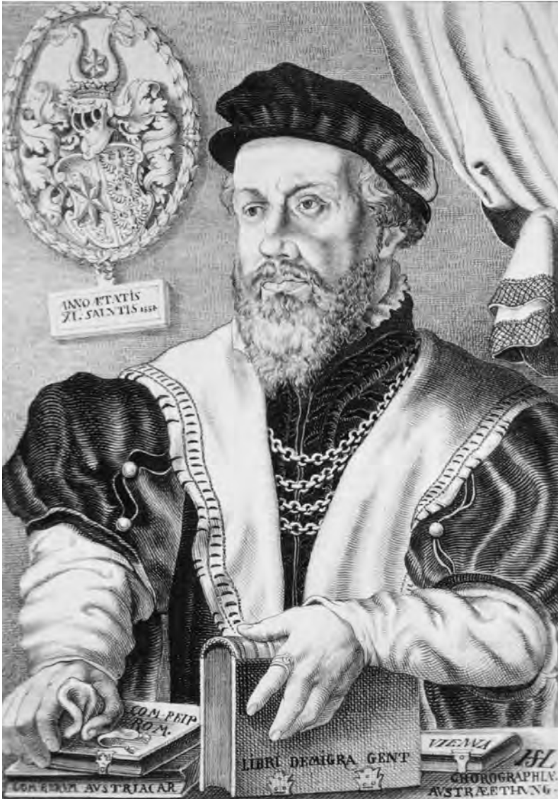
Fig. 7 Hans Sebald Lautensack Portrait de Wolfgang Lazius, 1554