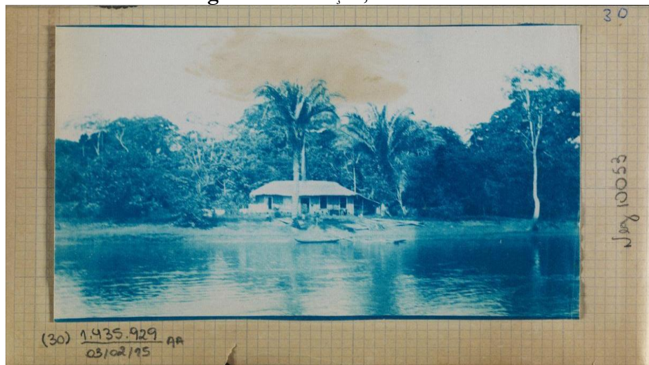
Figura 2: Habitação, 1907 - 1912