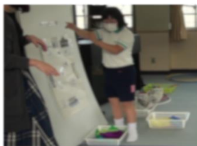
写真4 ミュージックルームづくり

しさがあった（写真4）。「早く地図をつくりたい」「1年生が取りやすいように置いたよ」などと期待感や他者への配慮の気持ちを持ち授業に臨んでいることがうかがえた。G児は徐々に、「（新体操用）リボンを置きたい」と伝達できるようになり、好きな位置に置いたことに上級生が同意すると満足した様子であった。児童同士で配置場所に相違があっても、チェンジタイムがあることで全児童の思いが実現できた。ミュージックマップ（写真5）は、音楽室を対角線上に走ったり、場を広く使ったりする児童が増えるなど音楽室の空間把握につながった。