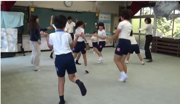
写真1 【実践事例1】での児童の学習の様子