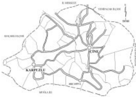
Şekil 1. Çine-Karpuzlu'da Tarama Yapılan Alanlar

Aydın ili konum olarak; 37° 30' ve 38° 03' kuzey enlemleriyle 27° 00' ve 28° 57' doğu boylamları arasındadır. Çine ilçesi, il merkezine 38km uzaklıkta Aydın-Muğla karayolu üzerinde ve ilin güneyindedir. Karpuzlu ilçesi ise merkeze 56km uzaklıkta ve Büyük Menderes vadisinin kollarından biri olan Çine havzasında yer almaktadır. Yöre topraklarının doğu ve güney bölümleri dağlık, batı ve kuzey bölümünün bir bölümü ovalıktır. Dağlar arasında kalan Çine ovası alüvyiyal birikintilerle oluşmuş önemli tarım alanıdır (Şekil 1).