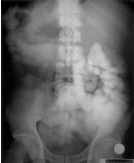
Resim 1. İntravezikal kontrast madde verilerek çekilen direkt batın grafisinde opak maddenin ince ve kalın barsağa geçtiği görüldü.

Hidronefroz tümöral obstrüksiyona bağlanarak hastaya sol perkütan nefrostomi yapıldı ve izleme alındı. İdrar çıkışının olmasına rağmen asidozda düzelme saptanmadı. Bu izlem sırasında rektal kanama ve ishal ortaya çıktı. Hastaya intravezikal olarak verilen metilen mavisinin birkaç saat sonra dışkıda izlenmesi barsak-mesane arası fistül varlığını gösterdi. İntravezikal kontrast verilerek yapılan direkt grafide opak maddenin ince ve kalın barsakta görülmesi ile ince barsak-mesane arası fistül varlığı kesinleşti (Resim 1). Oral, rektal ve intravenöz opak madde verilerek yapılan tüm abdomen bilgisayarlı tomografisinde sol yan arka duvarda kısmen intravezikal, ağırlıklı olarak ekstravezikal kitle ve prerektal yağ dokusu infiltrasyonu görüldü.