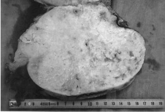
Resim 2: Kondrosarkom kesit yüzü : Parlak beyaz renkte, jelatinöz özellikte, nodüler alanlar

Geniş cerrahi eksizyon haricinde ek bir tedavi