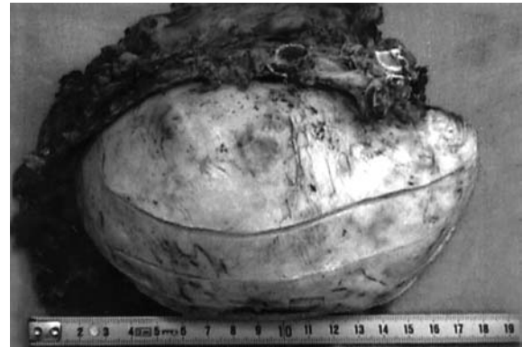
Resim 1 : Kondrosarkomun makroskopik görünümü : İy sınırlı, dış yüzü lobüle görünümdeki kitle

uzanan oblik bir cilt kesisi ile operasyona başlandı. Kitlenin lateralinden interkostal kesi ile toraksa girildi. Kitlenin akciğer ile hiçbir bağlantısının olmadığı gözlemlendi. Güvenli cerrahi sınır bırakılarak en blok olarak toraks duvarının tüm katları ve kasları ile birlikte rezekte edildi. Toraksda oluşan defektin rekonstrüksiyonu için kot şeklinde hazırlanmış ve toraks duvarına uygun konvavitesi verilmiş halde metil metakrilattan iki adet greft oluşturuldu. Bu greftler mersilen mesh yama içine çift kat olarak prolen sütürler ile tespitlendi. Daha sonra yapmış olduğumuz rekonstrüksiyon materyali gergin olarak 0/0 ve 1No prolenler ile tek tek sütür tekniği kullanılarak çepçevre toraks duvarına tespit edildi.