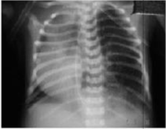
Resim 1: Sol akciğerde havalanma fazlalığı ve kaba retikülogranüler görünüm ile sağ hemitoraksa yer değiştirmiş kalp görünümü.