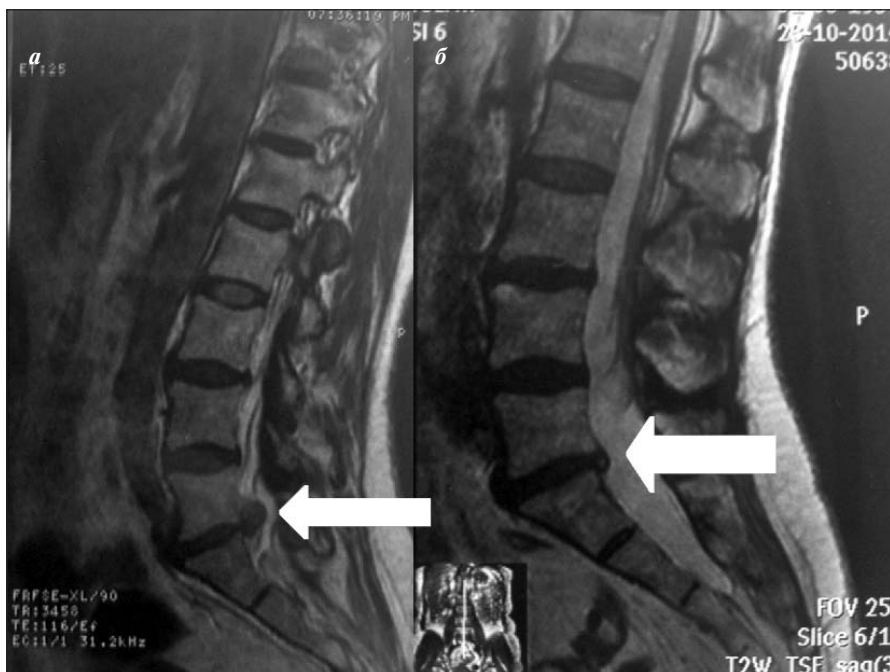
Рис. 1. МРТ позвоночника в режиме T2 (сагиттальная проекция). а – экструзия диска L 5 –S 1 (стрелка); б – регресс экструзии диска через 8 мес (стрелка)

расстройствам в соответствующих дерматомах, слабости иннервируемых мышц. Со временем состояние большинства пациентов улучшается независимо от лечения. Грыжа диска часто регрессирует со временем, однако в ряде случаев не наблюдается уменьшения размеров диска и регресса симптомов. В диагностике радикулопатии большое значение имеют тестирование мышц пораженного миотома, исследование чувствительности и симптомов натяжения (тест поднятой ноги в положении сидя и лежа, прямой и перекрестный симптомы Ласега). Вспомогательными считаются такие симптомы, как усиление боли при кашле или разгибании поясничного отдела, ограничение подвижности позвоночника, отсутствие рефлексов, симптом Вассермана. Магнитно-резонансная томография (МРТ) – наиболее информативный неинвазивный метод диагностики грыжи межпозвоночного диска. При наличии противопоказаний для проведения МРТ или отсутствии изменений выполняют рентгеновскую компьютерную томографию (КТ) или КТ-миелографию [2].