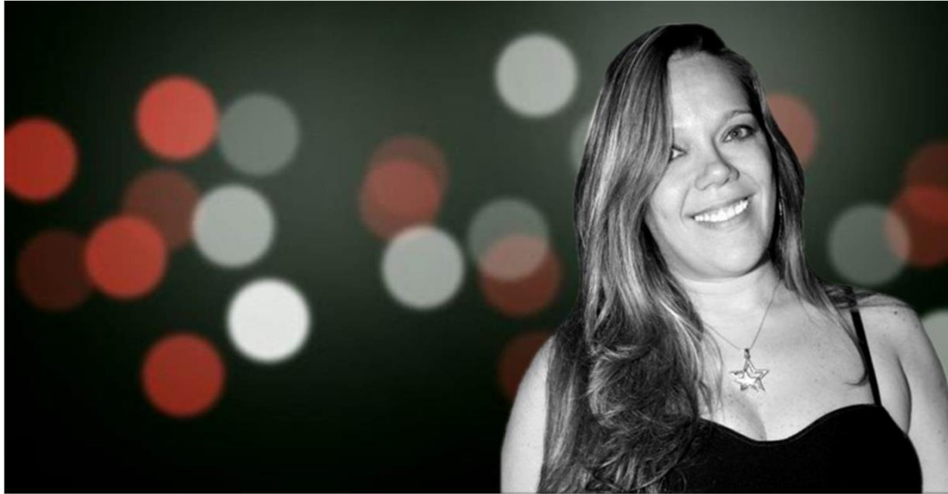
Figura 3- Usuária do Facebook postando foto do congelamento em 'Avenida Brasil'.

falas dos personagens caracterizando de maneira eficiente o subúrbio. Estas duas variáveis presentes em 'Avenida Brasil' fez com que em grande escala o fenômeno 'Social TV' fosse verificado no Brasil principalmente por meio da rede social virtual Facebook.