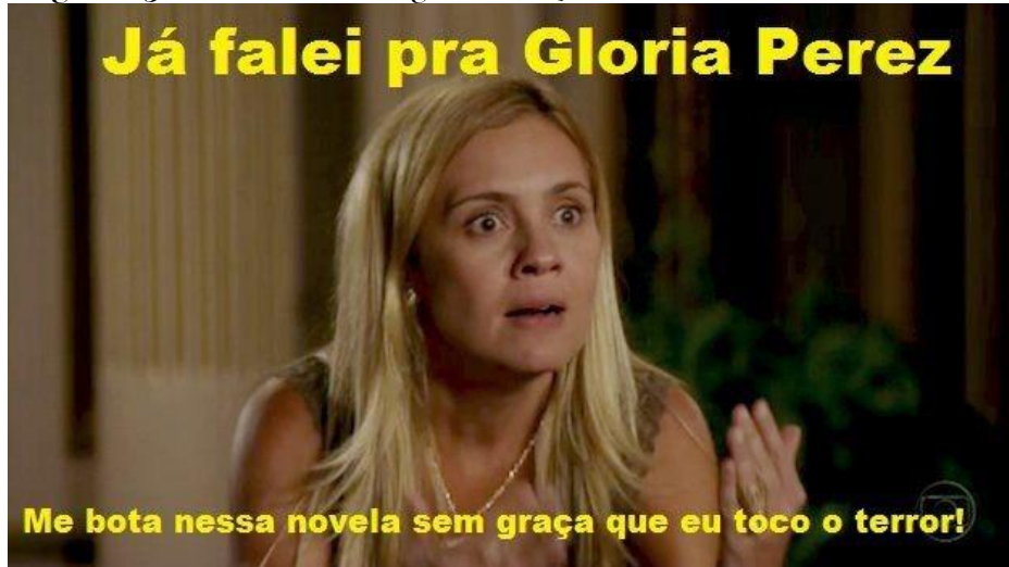
Figura 05 – Sátira à ‘Salve Jorge’ em relação à falta de criatividade e dinâmica da novela.

aproximação com a realidade social, econômica ou cultural, mas também da criatividade do autor em propor histórias interessantes para o público.