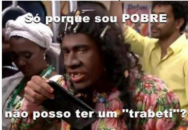
Figura 02 – Co-criação de conteúdo dos telespectadores nas redes sociais virtuais