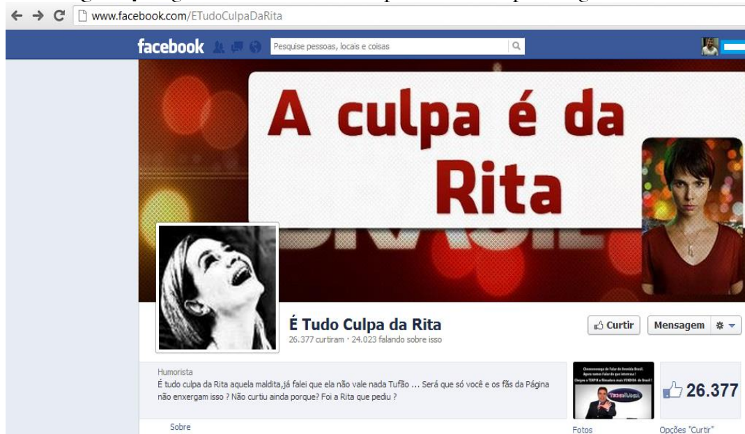
Figura 4- Página com o bordão 'A Culpa é da Rita' da personagem Carminha.