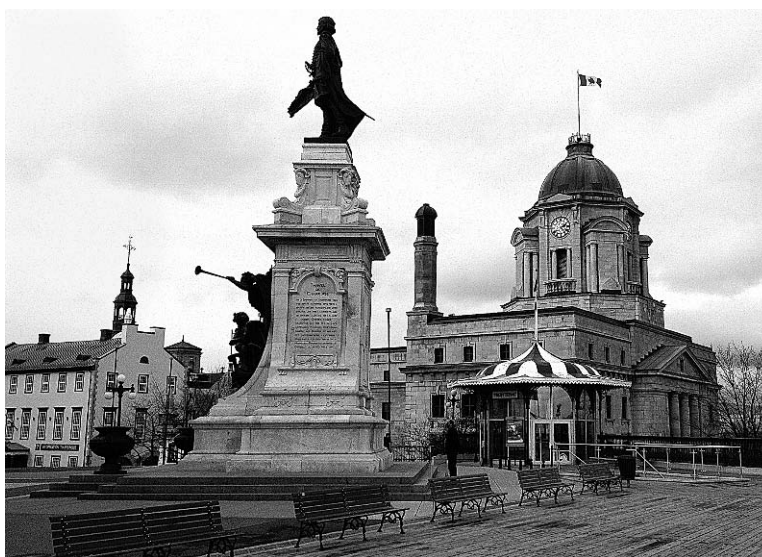
La ville de Québec a accueilli les JFREM dans le cadre d'un congrès plus général consacré à l'apprentissage de la musique.

Le thème du congrès, relativement large, traitait de l'apprentissage de la musique et de son apport pour la vie