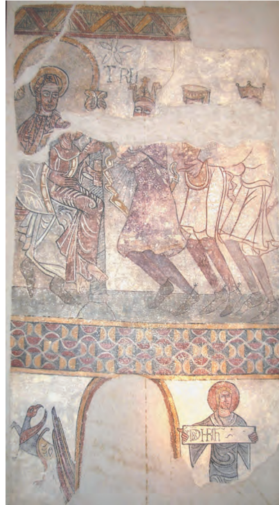
Fig. 5 : Adoration des Mages, Hospice d'Ille-sur-Têt.

Dans le panneau inférieur, de part et d'autre de la fenêtre, on apercevait un griffon et un personnage déployant un phylactère avec une épigraphe qui a perdu la partie droite. L'inscription en lettres capitales, très difficile à déchiffrer, est tracée en noir dans un rectangle blanc, avec quelques lettres à l'envers : GNLBR-CHRTIH. Selon nous, ce texte doit être lu de la manière suivante : G(e)N(erationis) L(i)B(e)R CHRI(s)T(i) IH(esu), car il s'agit du début de l'Évangile de Matthieu : « Liber generationis Iesu Christi filii David, filii Abraham » (Mt. 1, 1). Il faut rappeler que les textes avec les débuts des quatre Évangiles étaient utilisés en Catalogne romane lors du rituel de la bénédiction de l'autel, d'après les indications de l'ordo catalano-narbonnais , comme l'attestent