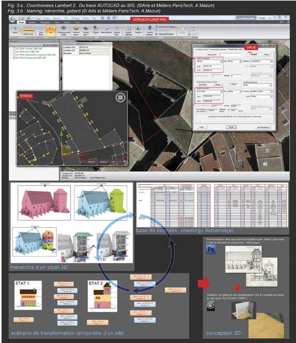
Fig. 3 – a. Coordonnées Lambert 2. Du tracé AutoCAD au SIG (Arts et Métiers ParisTech, A. Mazuir); b. Naming, hiérarchie, gabarit (Arts et Métiers ParisTech, A. Mazuir).

qui sont mises aux proportions dans le logiciel Photoshop. Dans 3ds Max le tracé de la zone de travail est dupliqué et ramené en coordonnées 0-0-0 pour corriger les problèmes de précision dans les manipulations, ou opérations d'édition des objets. À l'aide de prises de mesures sur site, complétées par des