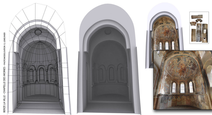
Berzé-la-Ville, la Chapelle-des-Moines, photomodélisation 3D.