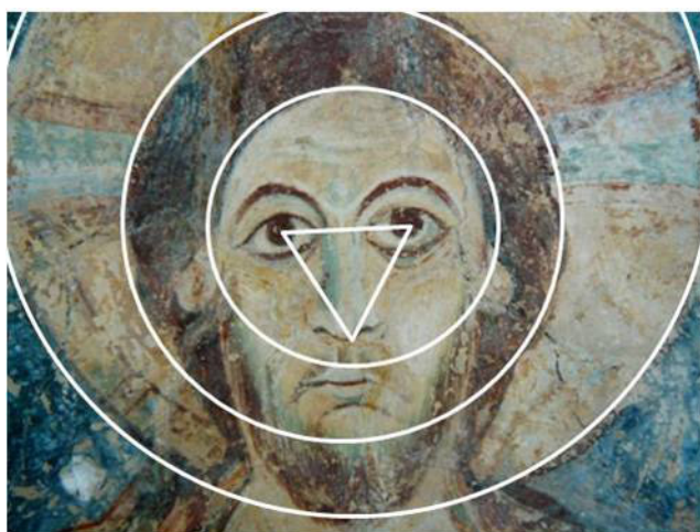
Berzé-la-Ville, la Chapelle-des-Moines, visage du Christ.