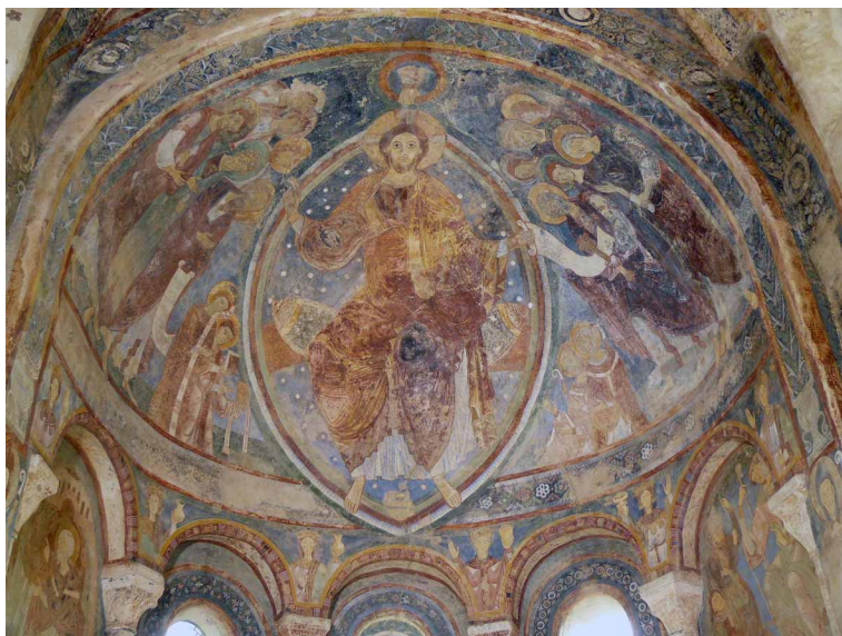
Berzé-la-Ville, la Chapelle-des-Moines, vue de l'abside.