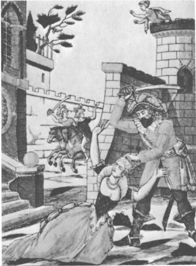
Houtsnede bij Blauwbaard , begin 19de eeuw