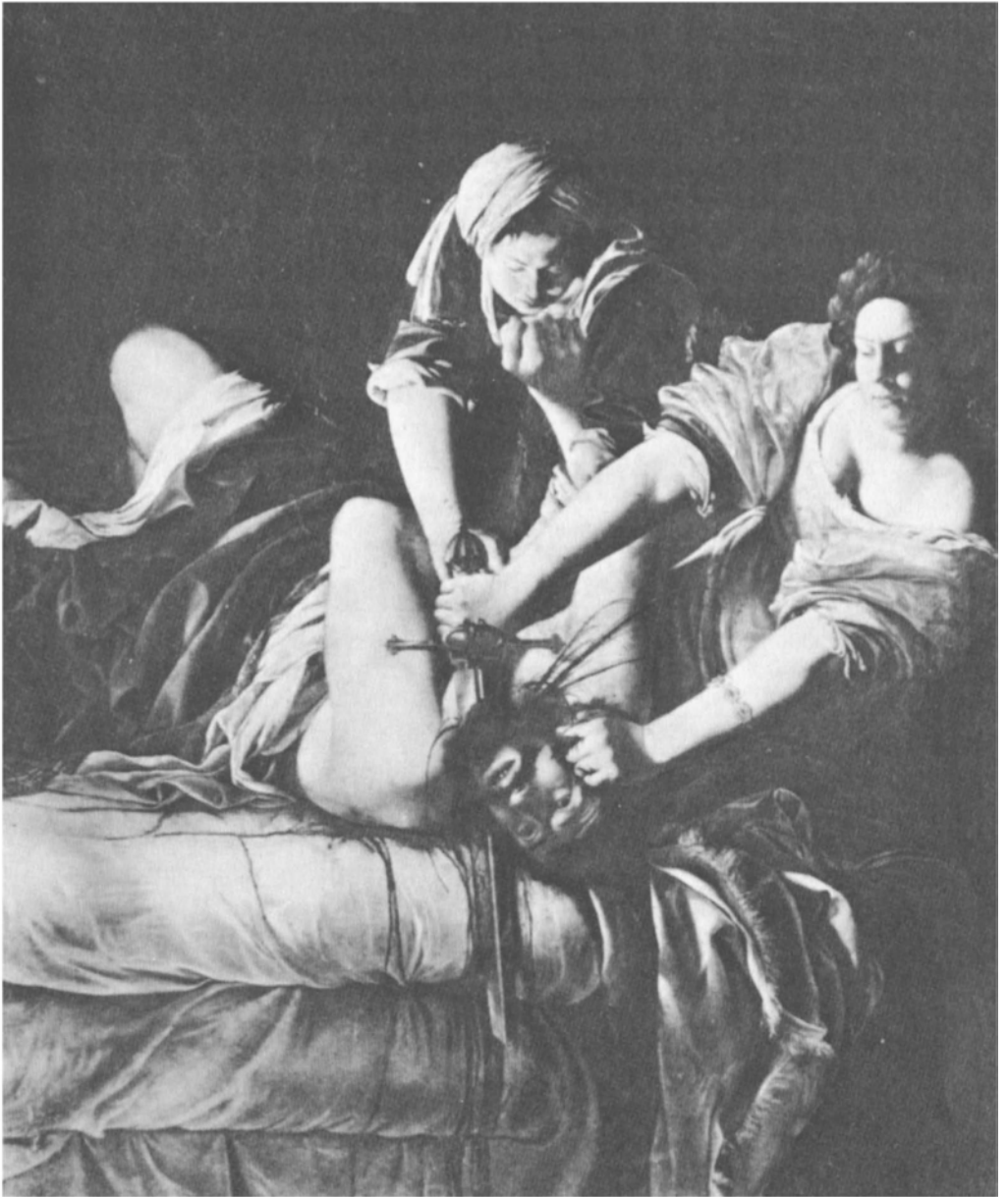
Artemisia Gentileschi , Judith onthoofdt Holofernes (1616-1620)