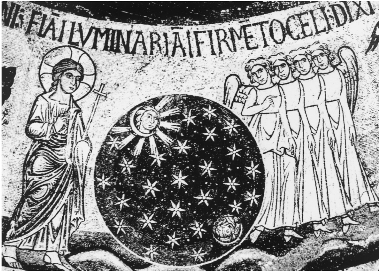
De schepping van zon, maan en sterren, mozaïek uit de dertiende eeuw in de San Marco in Venetië

eigenschappen. Dit Woord behoort tot dezelfde natuur als God en deelt met God hetzelfde kader van tijd en plaats.