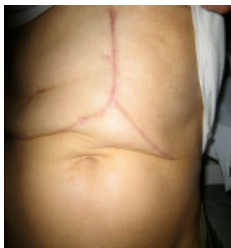
Cicatriz en la receptora

fermedad hace presente en nosotros al cuerpo, nuestro cuerpo enfermo y a veces maldito, que de forma habitual pasa del todo inadvertido (1996). También nos lo recordaba poco antes de morir Harold Brodke en su libro Esta salvaje oscuridad : “La realidad del SIDA como fatalidad compleja (y total) produce en el paciente una suerte de distante asombro ante el médico. Si uno es humano ¿qué hace al verse enfrentado con la profunda humillación de la derrota?”. Es así que el cuerpo, fracturado o como derrota no es asumible a través de la vía racional; hace falta que nos adentremos en nuestras propias sensaciones para conocerlo de forma más precisa, de forma encarnada. En este sentido son válidas las palabras del filósofo español, Emilio Lledó para seguir pensando el cuerpo. Para éste, se trata de “una anatomía terminológica y semántica donde el paisaje lingüístico que disecciona nos enseña el sentido, el pensamiento, los valores que han ido descubriendo al tocar, herir y sanar el cuerpo entregado del paciente, el cuerpo sin dolor ya, puesto en sus manos” (2003: 13). Es cierta esa dimensión lingüística del cuerpo, que le permite arrancarse esa mirada unidireccional que lo sitúa en el plano anatómico y lo permite subjetivarse.