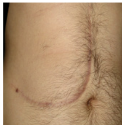
Cicatriz en el donante

Desde el mito de Frankenstein (con la búsqueda de la suma de órganos para crear y recrear una subjetividad corporal distinta) hasta