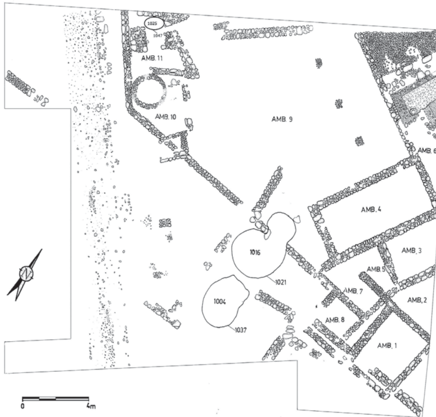
Fig. 7. Plano con los basureros que se formaron en la fase final y de abandono.