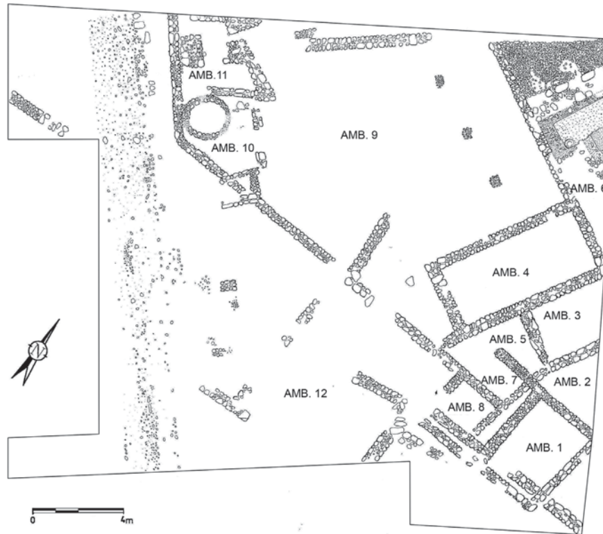
Fig. 2. Plano general del yacimiento con detalles fotográficos (originales de López-Jover, 1998).