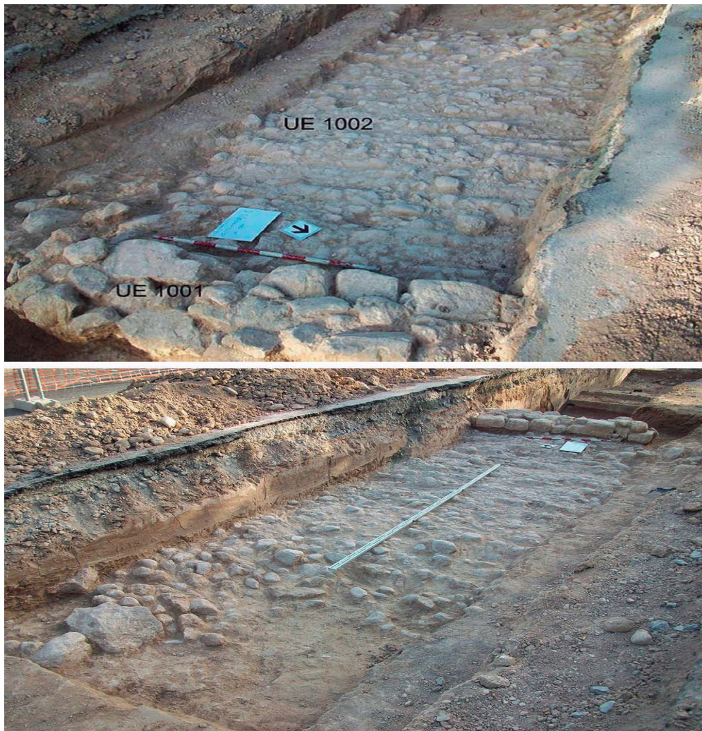
Fig. 9. Tramo de vía en la C/ Olimpo n.º 38 excavada en 2011.

C/ Olimpo y el Impiva-Fundesem. Este nuevo tramo presentaba un pavimento o empedrado de cantos rodados, de pequeño tamaño en su mayoría, dispuestos horizontalmente, con suave pendiente hacia el oeste (al igual que la calle) y extendido hacia el oeste de un muro (UE 1001). La anchura conservada de la vía es de 1,90 m, aunque parece que en el lado oeste el pavimento está muy erosionado. El material cerámico encontrado hizo pensar que fue construida en el cambio de era o durante la primera mitad del siglo I dC. Bajo el camino se halló la UE 1004, formada por arena de tonalidad anaranjada,