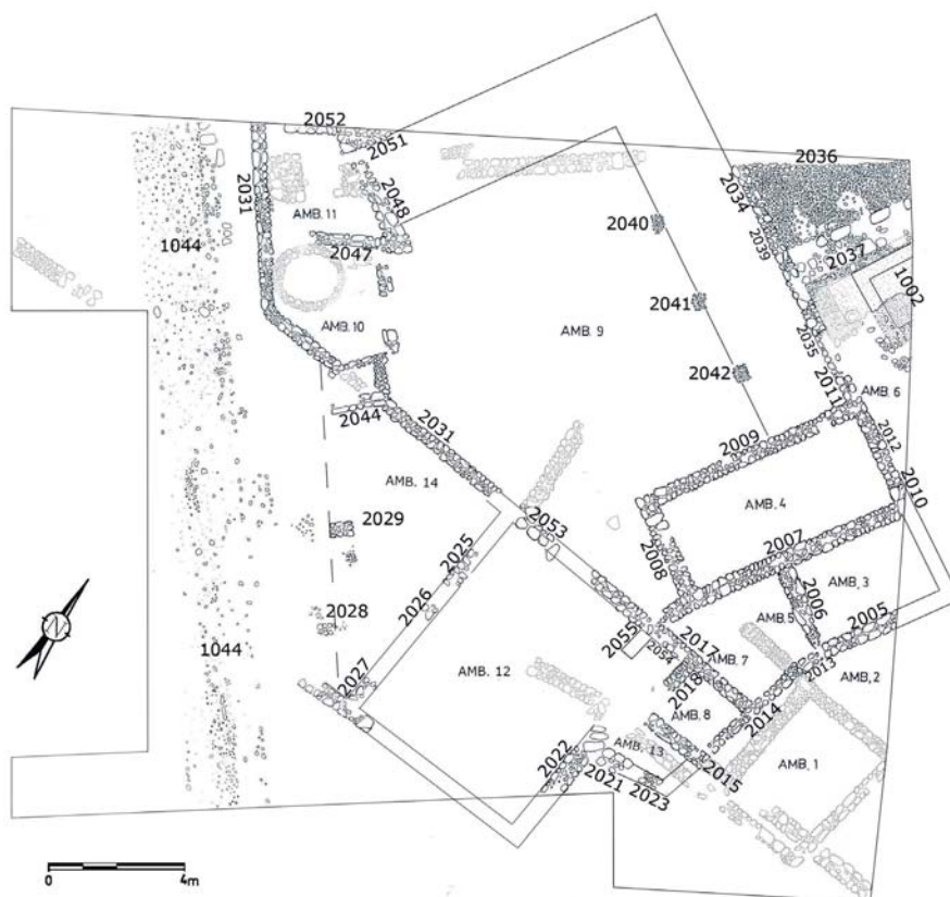
Fig. 5. Plano de la fase III.

En el sector occidental (amb. 10 y 11) se observa una remodelación que supone la amortización de la UE 2050 (posible horno) y la construcción de nuevos muros (UUEE 2046, 2045 y 2044, por un lado, y 2047 y 2052, por otro) que compartimentan esa área. El nivel de uso de esos espacios en esta fase (UE 1026) ofrece una cronología indeterminada del siglo I dC, pero en cualquier caso posterior a UE 1055, a la que cubre, y por tanto de la segunda mitad del siglo I dC.