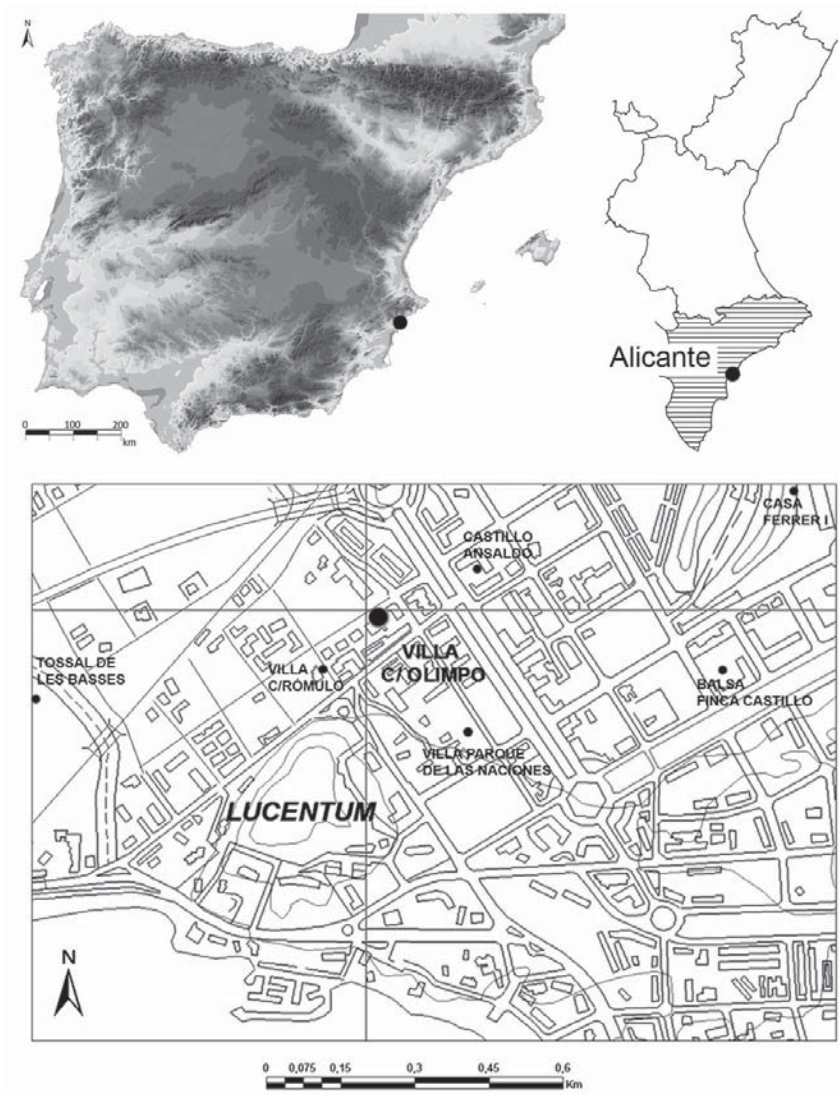
Fig. 1. Localización de la villa de la C/ Olimpo y entorno de Lucentum .

la que se conserva buena parte de la documentación, unidades y diagramas, fotográfica y planimétrica (López- Jover, 1998). Los materiales arqueológicos, como es preceptivo, fueron depositados junto al informe preliminar en el MUSA del Ayuntamiento de Alicante (cerca de 40 cajas), aunque parte del material (2 cajas) ha sido localizado en el MARQ de la Diputación de Alicante.