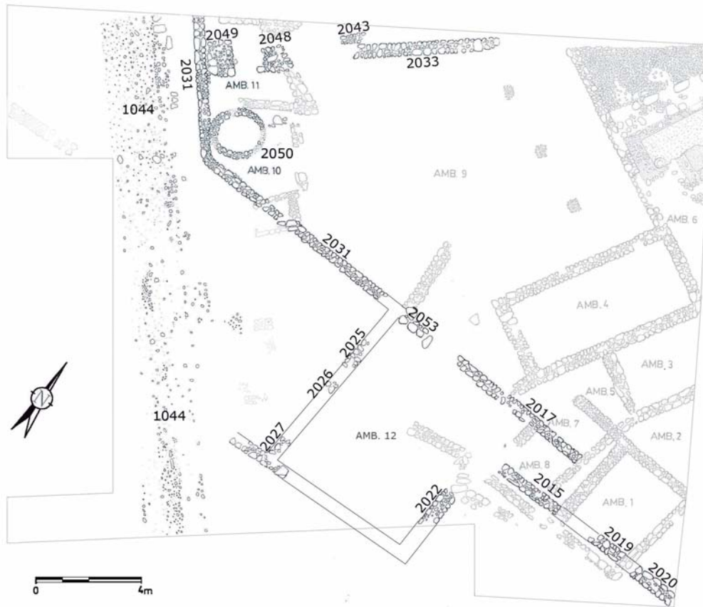
Fig. 4. Plano de la fase II.

vía, mediante la construcción de un muro paralelo a la misma (UE 2049) que marca la reutilización de estructuras (amb. 10-11). En este sector hallamos una estructura circular-oval de 2,30 m de diámetro (UE 2050) que podría interpretarse como un horno cuyos niveles de uso (UUEE 1043 y 1050) presentan dataciones preaugusteas. Los materiales datantes de las UUEE 1043 y 1050 nos sitúan en el tercio central del siglo I aC con ánforas Dressel 1A, Lamboglia 2 (140-20 aC) y LC67-Ovoide 1 (70-20 aC) junto a cerámicas de barniz negro B del tipo Lamboglia 1/Morel 2321 (150-25 aC).