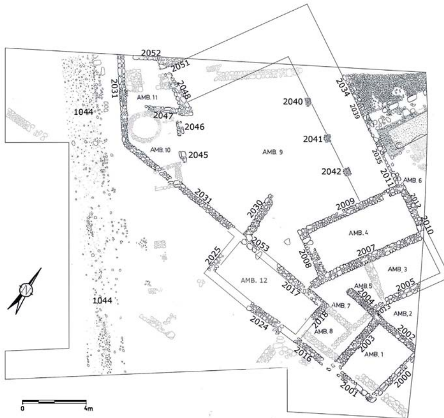
Fig. 6. Plano de la fase IV.