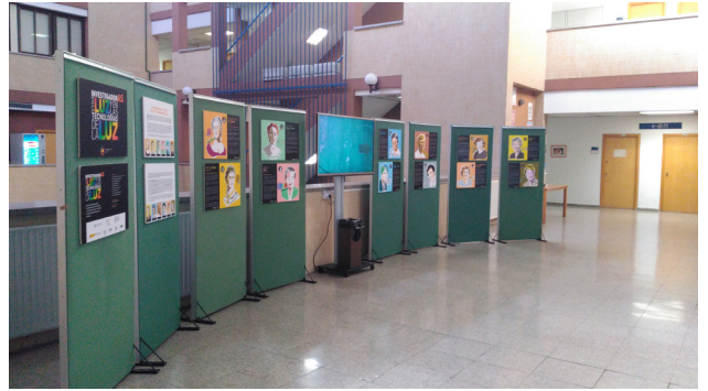
Figura 4. Exposición en la Facultad de Ciencias de la UNED.

Con el fin de alcanzar la máxima difusión, los contenidos de la exposición y del calendario son de libre acceso en la página web oficial (en España) del Año Internacional de la Luz [1, 2] por lo que muchas universidades y otros centros han optado por descargarlos e imprimir sus propios paneles. Así lo han hecho la Universidad de Alicante, en la que se expuso del 2 de noviembre al 23 de diciembre de 2015, la Universidad de Santiago de Compostela que la expuso en el Campus de Lugo del 1 al 14 de diciembre y en la Escuela Politécnica Superior, en Santiago de Compostela, coincidiendo con la Jornada Mulleres na Ciencia, celebrada el 15 de diciembre de 2015. Desde el 3 de marzo hasta el 11 de abril