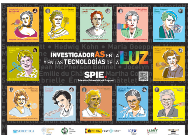
Figura 7. Cartel de la exposición realizado para centros de Educación Secundaria.