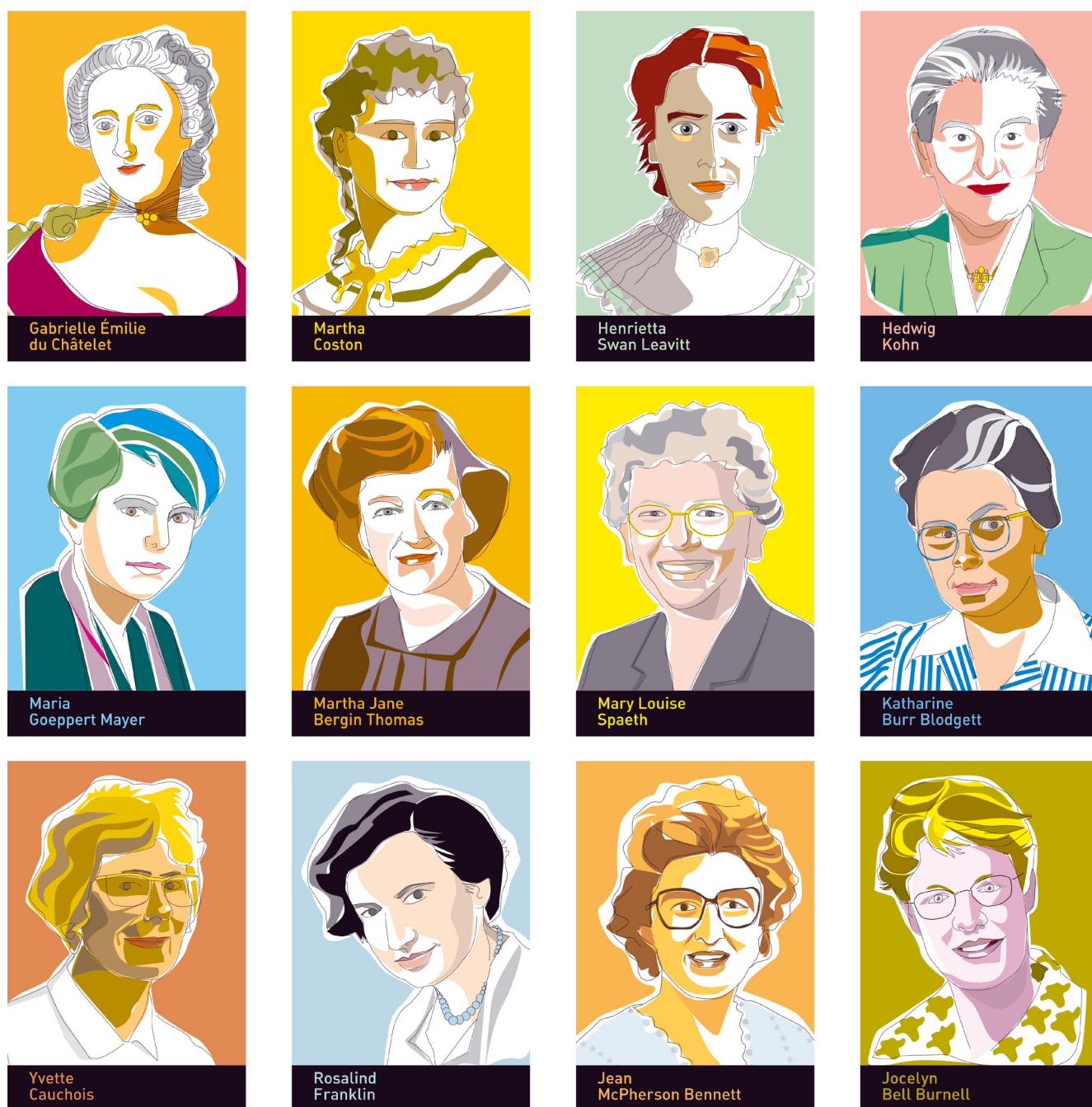
Figura 1. Diseño gráfico de cada una de las investigadoras elegidas para la Exposición y el Calendario 2016.

Ciències Fotòniques (ICFO), la Asociación de Mujeres Investigadoras y Tecnólogas (AMIT) y la International Society for Optics and Photonics (SPIE). Para la realización del calendario, también contribuyeron las unidades de igualdad de la Universidade de Santiago de Compostela y de la Universidade da Coruña.