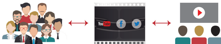
Imagen 3. Sujetos, contenidos y audiencias como elementos analizados.

Con el fin de simplificar el objeto de estudio, todos estos factores quedan resumidos en la siguiente infografía.