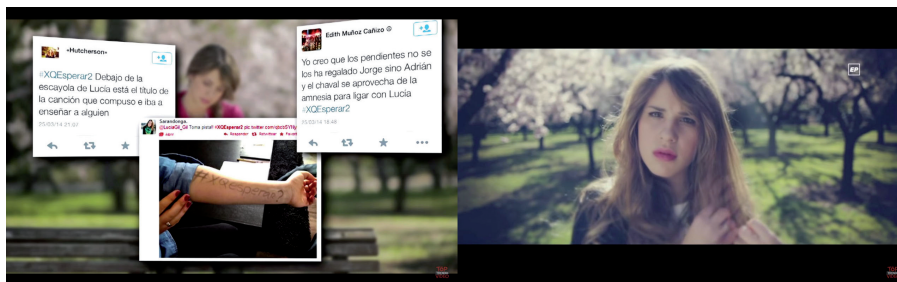
Imagen 5. Frames del segundo capítulo de XQ Esperar 2 .

El primer capítulo termina con una llamada a los seguidores de Lucía, quien solicita pistas a sus seguidores para que le ayuden a recordar su vida anterior. Y para ello, los usuarios pueden hacérselas llegar a través de las redes sociales. Cuestión que la protagonista agradece al principio del segundo capítulo incluyendo alguno de los tuits recibidos con pistas de los seguidores. La entrega continúa con los títulos de crédito iniciales seguidos de los primeros planos del capítulo en el que observamos la sobreimpresión legal relativa al emplazamiento publicitario, dado que la webserie se difundía igualmente a través del portal de Antena 3 especializado en webseries .