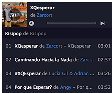
Imagen 1. Sección RisiPop.