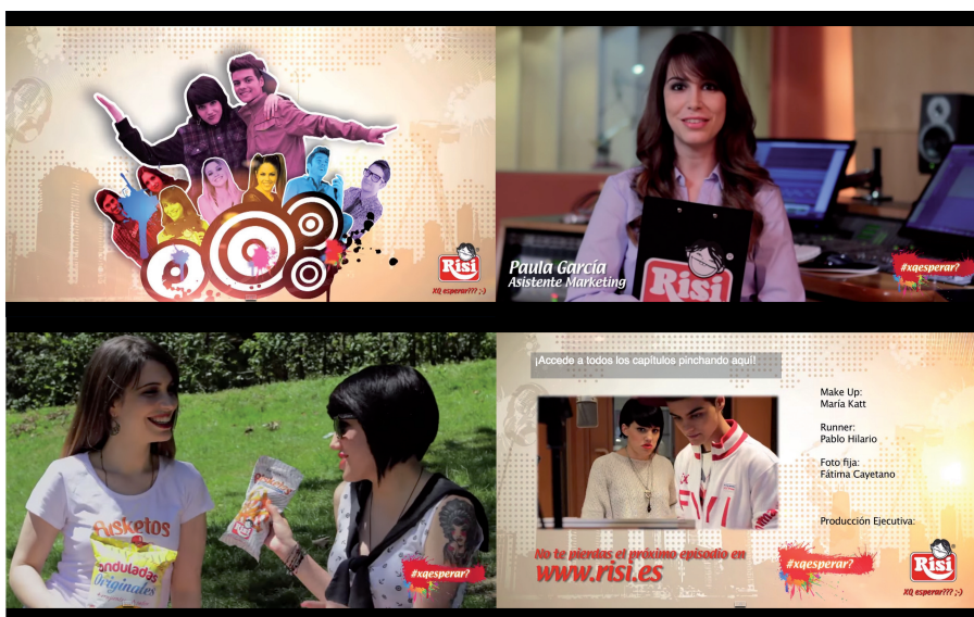
Imagen 4. Frames de XQesperar? de Risi.

Ésta será la estructura que seguirán los restantes siete capítulos de la webserie publicada semanalmente los miércoles comprendidos entre el 8 de mayo y 26 de junio del año 2013 en el canal de Youtube de la marca. En ellos, se desarrollan narraciones que van desde la búsqueda del título de la canción, el surgimiento del amor entre miembros del equipo, el encuentro con los fans , los imprevistos y problemas surgidos en el desarrollo de las actuaciones, los malentendidos amorosos y el estreno privado de la canción ante los incondicionales de los famosos cantantes.