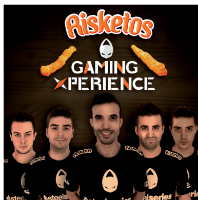
Imagen 2. Risketos Gaming Xperience .

En 2015 promueve Risketos Gaming Academy , una experiencia gamer creada en colaboración con el club profesional de deportes electrónicos xbtence , campeones españoles de videojuegos. Juntos difunden cursos y tutoriales y celebran torneos para los apasionados de los videojuegos, principalmente adolescentes y jóvenes.