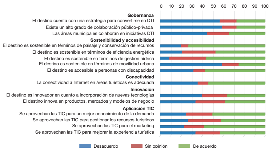
Gráfico 1. Valoración de los ámbitos del destino turístico inteligente.

Tras la valoración general del enfoque de los destinos inteligentes, se pidió a los encuestados su opinión acerca de los aspectos que configuran los diferentes ámbitos de los destinos inteligentes identificados previamente: gobernanza, sostenibilidad, conectividad e innovación. El ámbito correspondiente a sistemas de información se analiza más específicamente en el apartado de uso de las TIC, el cual complementa la visión sobre los apartados mencionados. El gráfico 1 resume la valoración de los diferentes ámbitos.