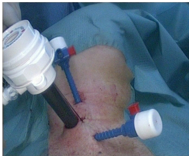
Figura 2 Posicionamiento de los trocares en el cuello.

Los 3 trocares se posicionan sobre la línea del borde anterior del músculo esternocleidomastoideo (SCM) (fig. 2). El procedimiento es llevado a cabo en 3 pasos: primer paso o fase abierta : se realiza una incisión de 15 mm transversa sobre el borde anterior del SCM, justo caudal al cartílago cricoides. Se inicia la disección en el plano entre el borde anterior del borde del SCM y el borde posterior de los músculos infrahioides, y justo por debajo del musculo homohioideo. Entonces, se divide cuidadosamente la fascia que conecta la cara posterior del lóbulo tiroideo con la vaina carotídea, lo suficiente para visualizar la fascia prevertebral. Para favorecer el incremento del área de trabajo se