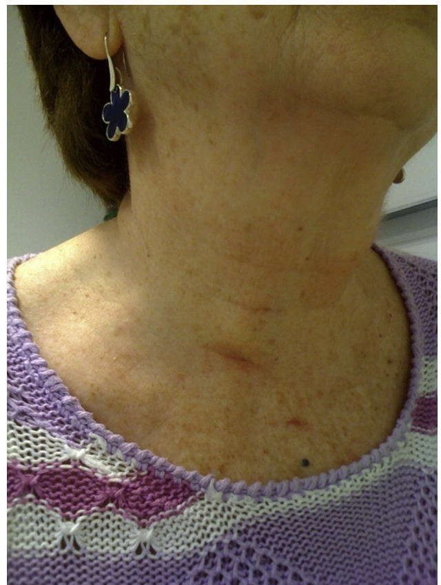
Figura 4 Resultado estético al mes de la intervención quirúrgica.

El nervio laríngeo recurrente se identificó en 26 (95%) de 28 casos, tanto como la glándula paratiroides ipsilateral en 14/28 (50%). Fue necesario un abordaje bilateral en un