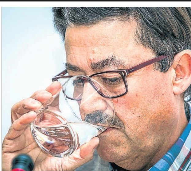
L'excap de la Guàrdia Urbana de Barcelona va llegir ahir un comunicat amb la seva versió