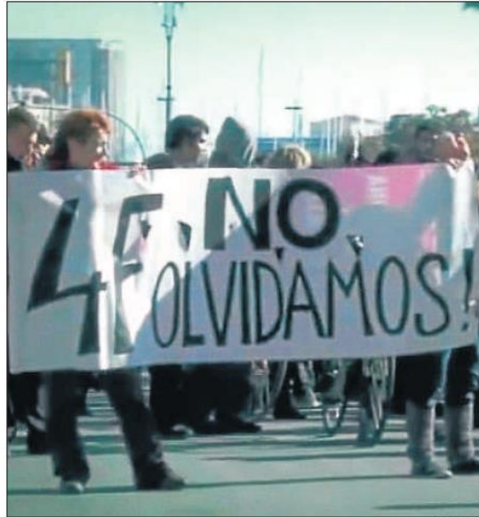
Imatge extreta del documental premiat per l'Ajuntament

El jurat ha premiat Ciutat morta com a "exercici de llibertat d'expressió a través d'un cinema de denúncia indispensable en qualsevol societat". Ciurana es va limitar a afirmar que la presència del documental en el palmarès