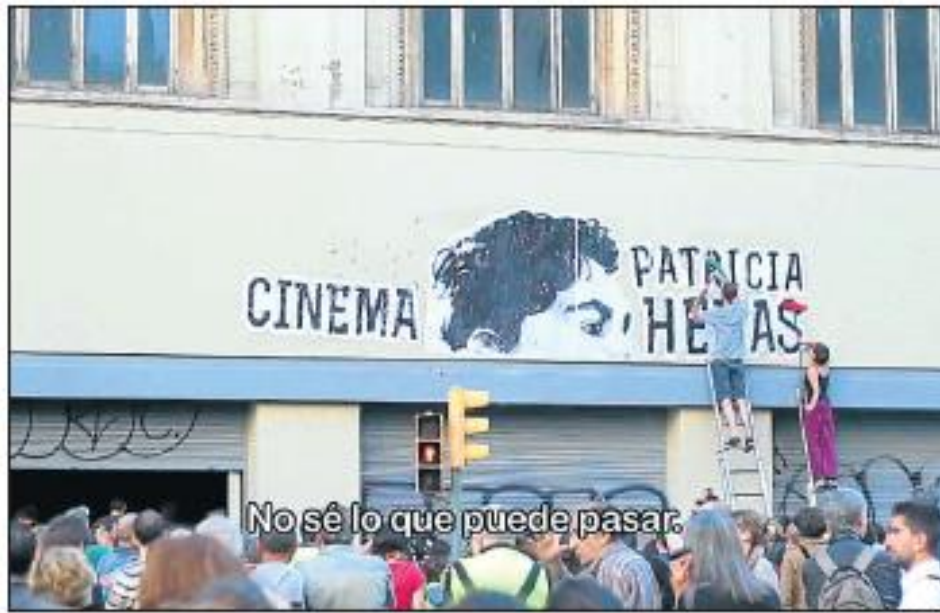
El documental. Una primera versió de Ciutat morta es va estrenar en un cinema ocupat de Via Laietana. Hi van anar uns 800 persones. Aquest desenvolupament va quedar recollit, com mostra la foto, en la versió final de la producció