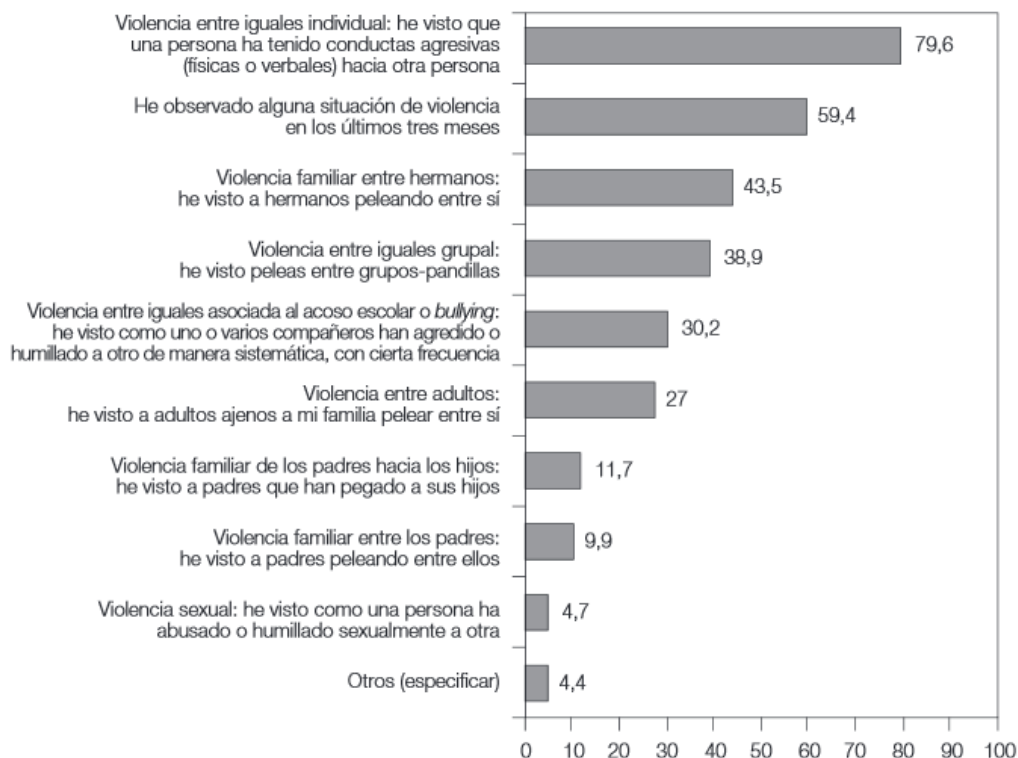
Tipos de situaciones de violencia observadas por los adolescentes del estudio en los últimos tres meses

Primero de todo, quiero analizar el clima de la presencia de los alumnos para verificar el nivel de violencia que existe con la muestra de jóvenes obtenida en este estudio.