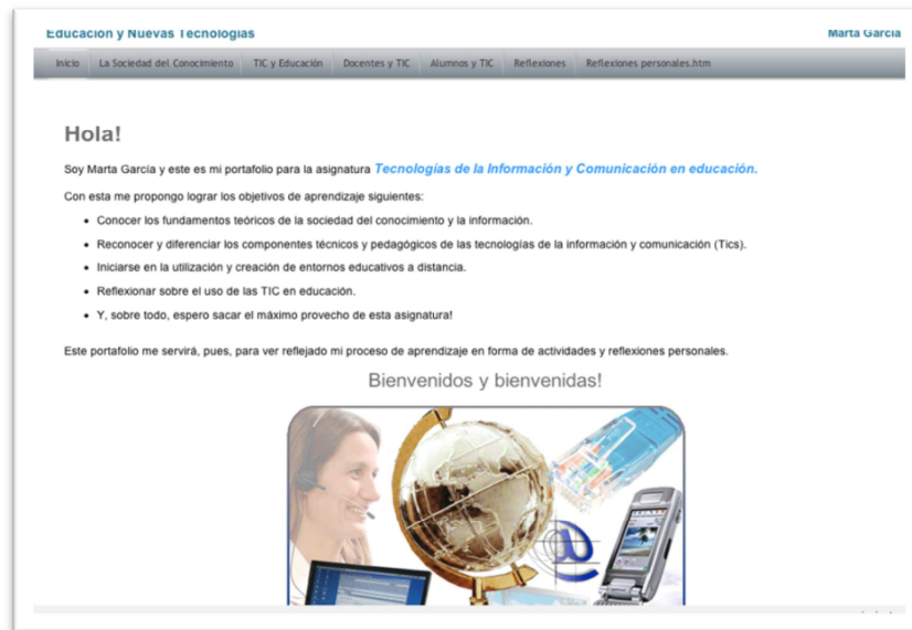
Imatge 1. Vista d'un portafolis en el que tota la informació està en format HTML per facilitar la navegació.

L'eina està enfocada a millorar l'aprenentatge dels estudiants tot atenent les guies proposades per l'Espai Europeu d'Educació Superior. Les bases que fonamenten l'actual model europeu educatiu i que Carpeta Digital potencia són l'aprenentatge basat en l'adquisició de competències i l'establiment d'una metodologia d'avaluació continuada. En aquest sentit destaca la funcionalitat de La gestió del seguiment de les competències i de l'avaluació del portafolis , mitjançant la qual els estudiants poden etiquetar les evidències d'aprenentatge amb les competències (definides per la institució o be personals) que estan desenvolupant i autovaluar el grau de progrés de cada competència. Així l'estudiant pot reconèixer amb quin tipus de documents els està demostrant i detectar necessitats formatives.