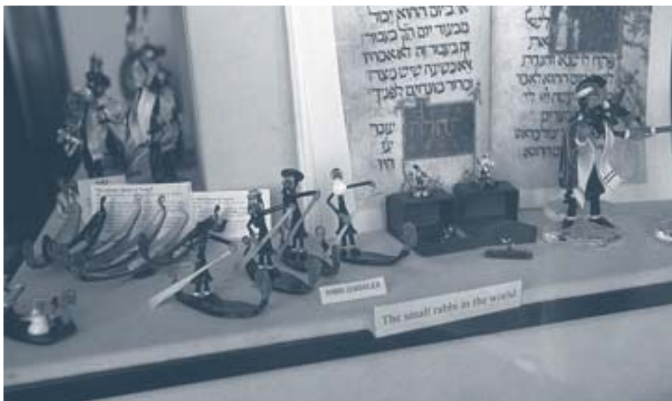
El redescobriments del barri jueu ha promogut el naixement de noves fonts d'ingressos com la dels records turístics.

litades per la Regió del Vèneto per a 1998 14 reflecteixen que, en el cas de Venècia, el 60% de les visites corresponen a visitants individuals, un 32,5% a escolars i un 7,5% a d'altres grups (associacions, etc.). El Museo Ebraico s'ajusta grosso modo a la mitjana.