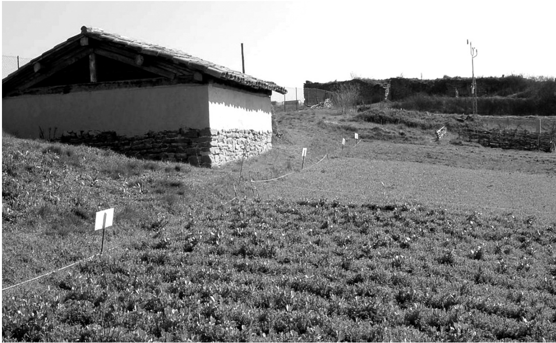
Arqueologia experimental: els camps i el graner medieval de l'Esquerda

Si apliquem el criteri econòmic de globalització a l'Arqueologia, ens plantejarem la intervenció a jaciments llunyans d'arreu del món —evidentment exòtics i rics— i amb mà d'obra local barata. El producte obtingut, la recerca, es recol·loca al món occidental i es revaloritza en forma de conferències, seminaris, exposicions, tesis doctorals i càtedres especialitzades. L'Administració està potenciant darrerament aquest tipus d'Arqueologia a l'estranger. 10 Potser caldria plantejar-nos si el nostre país s'ho pot permetre, i evitar que no es derivi cap a una forma nova del concepte decimonònic i colonialista de l'Arqueologia.