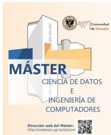
Figura 1. Portada del tríptico informativo del Máster en Ciencia de Computadores e Ingeniería de Computadores (disponible en http://masteres.ugr.es/datcom/ ).

El Máster Universitario en Ingeniería de Computadores y Redes surgió igualmente a partir del proceso de adaptación al EEES (R.D. 56/2005) del Programa de Doctorado “Ingeniería de Computadores: Perspectivas y Aplicaciones”. Este Programa de Doctorado se impartió ininterrumpidamente desde el curso 1999-2000 por el departamento de Arquitectura y Tecnología de Computadores de la Universidad de Granada, integrado por profesores de las áreas de Arquitectura y Tecnología de Computadores e Ingeniería de Sistemas y Automática, todos ellos miembros del grupo de investigación CASIP (Circuitos y Sistemas para el Procesamiento de la Información), reconocido como grupo de excelencia de la Junta de Andalucía con la referencia TIC-117. El programa obtuvo la Mención de Calidad del Ministerio (MCD2004-00438, BOE 5/7/2004). Desde ese momento, el programa ha concurrido a todas las convocatorias que se han sucedido para la renovación y seguimiento, habiéndose mantenido la Mención de Calidad desde 2004. Actualmente, estos dos programas de doctorado se encuentran en proceso de extinción, siendo sustituidos por el Programa Oficial de Doctorado en Tecnologías de la Información y la Comunicación de la Universidad de Granada [2].