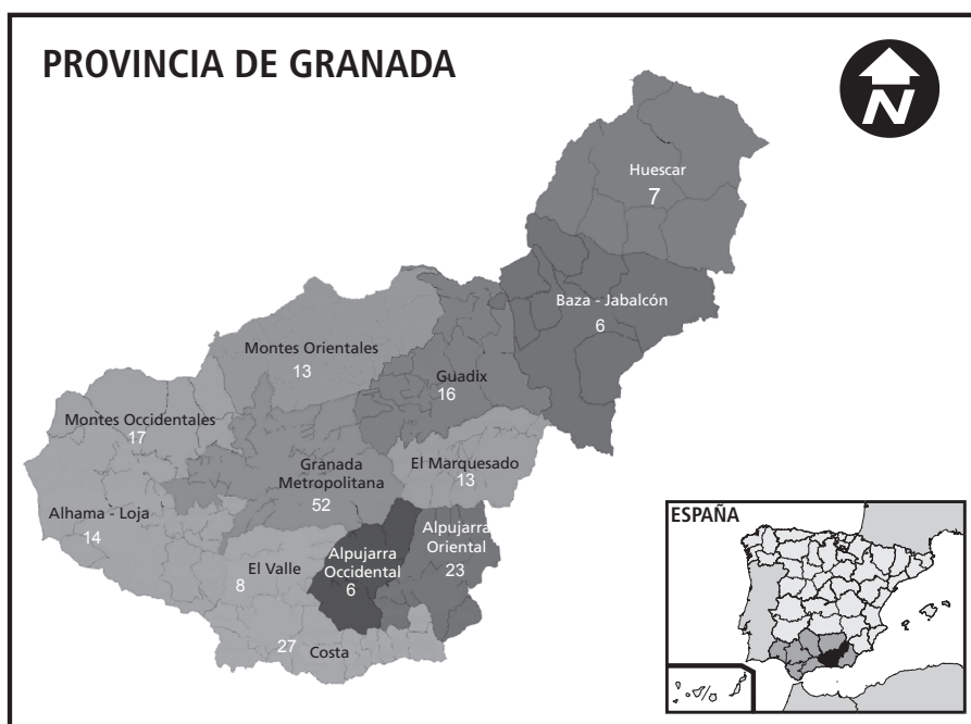
FIGURA 1. Número de asociaciones de mujeres por comarca en la provincia de Granada, Andalucía. (N=202)

El tejido asociativo de mujeres en el territorio granadino cuenta además con una amplia trayectoria, ya que casi dos tercios de las asociaciones (62,4%) superan los 10 años de existencia. Algo menos de 10% son de reciente creación, con menos de cinco años. El nacimiento de las primeras asociaciones de mujeres rurales las sitúa en la década de los ochenta, y coincidieron con dos hechos. Primero, la creación del Instituto de la Mujer (1983) que supuso la articulación de una red de Centros de Información de la Mujer en todo el territorio nacional, así como el establecimiento de Planes de Igualdad de Oportunidades de las Mujeres y de un sistema de apoyo técnico y presupuestario para el desarrollo de sus actividades. Y segundo, el ingreso de España en la Unión Europea (1986), lo que contribuyó al establecimiento del entramado institucional de género, pues se le exigió al país la adopción de la normativa comunitaria en materia de igualdad de oportunidades, al tiempo que España comenzaba a beneficiarse de financiación para estos temas (Puñal, 2001). A partir de entonces, se produjo un importante crecimiento a lo largo de los años noventa como se refleja en el figura 2.