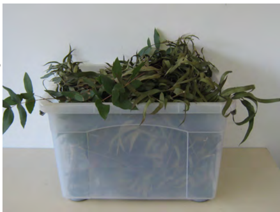
Figura 1. Recipiente para coleta de insetos no campo.