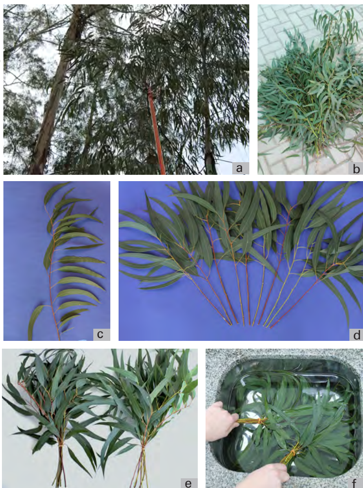
Figura 2. Procedimentos para criação massal do percevejo bronzeado: a, b, c, d, e) preparo de ramos; f) lavagem dos ramos.