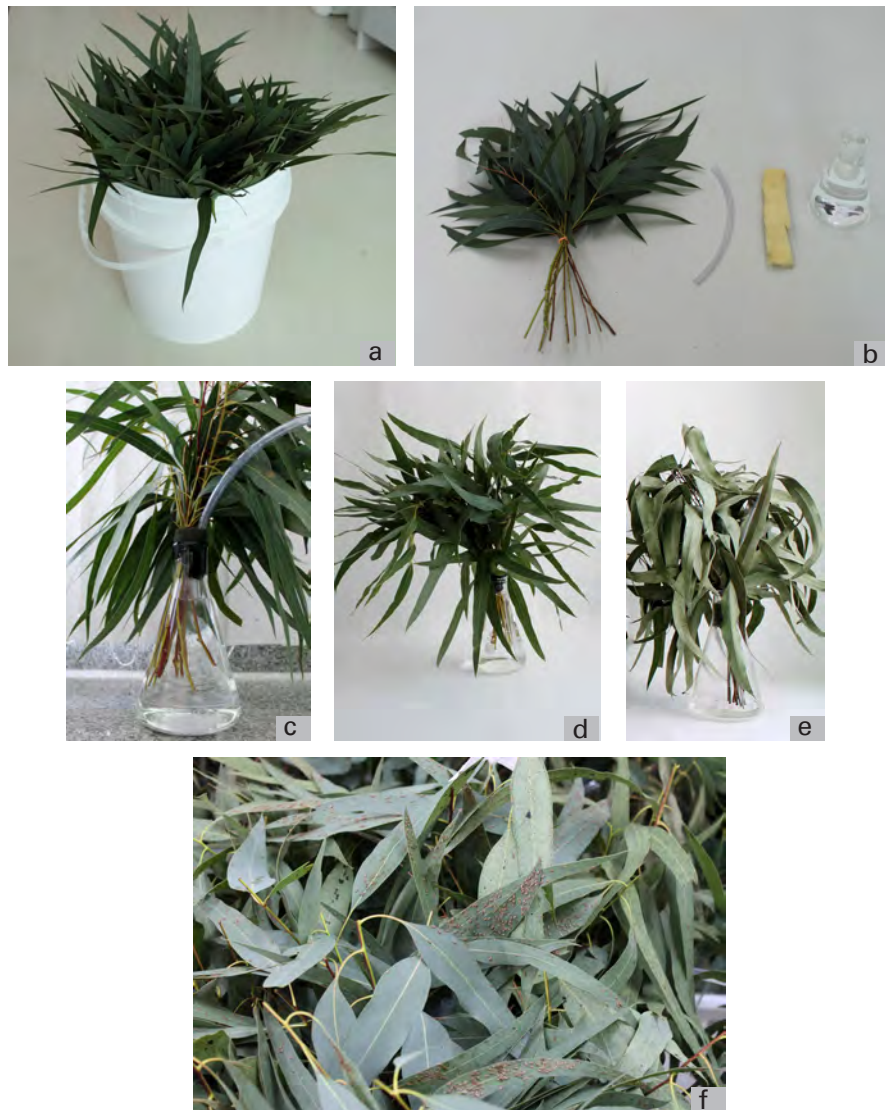
Figura 3. Procedimentos para criação massal do percevejo bronzeado: a) armazenamento de ramos; b, c) montagem de buquê; d) buquê novo; e) buquê velho; f) transferência de insetos.