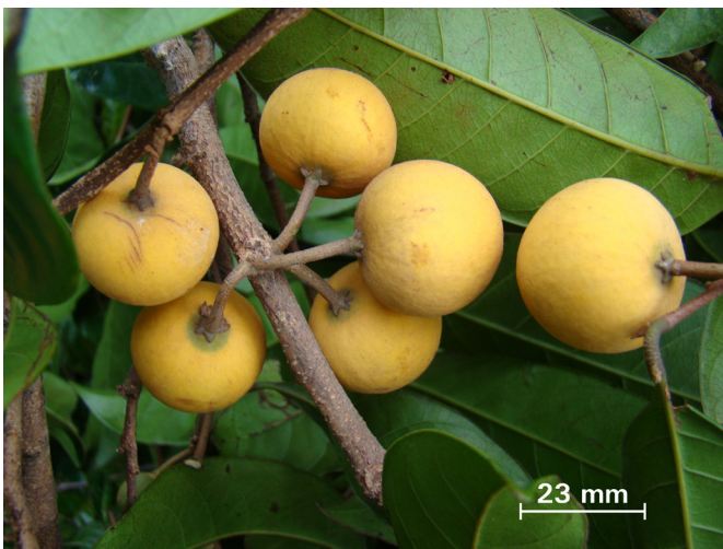
Figura 1. Frutos maduros de ajaraf.